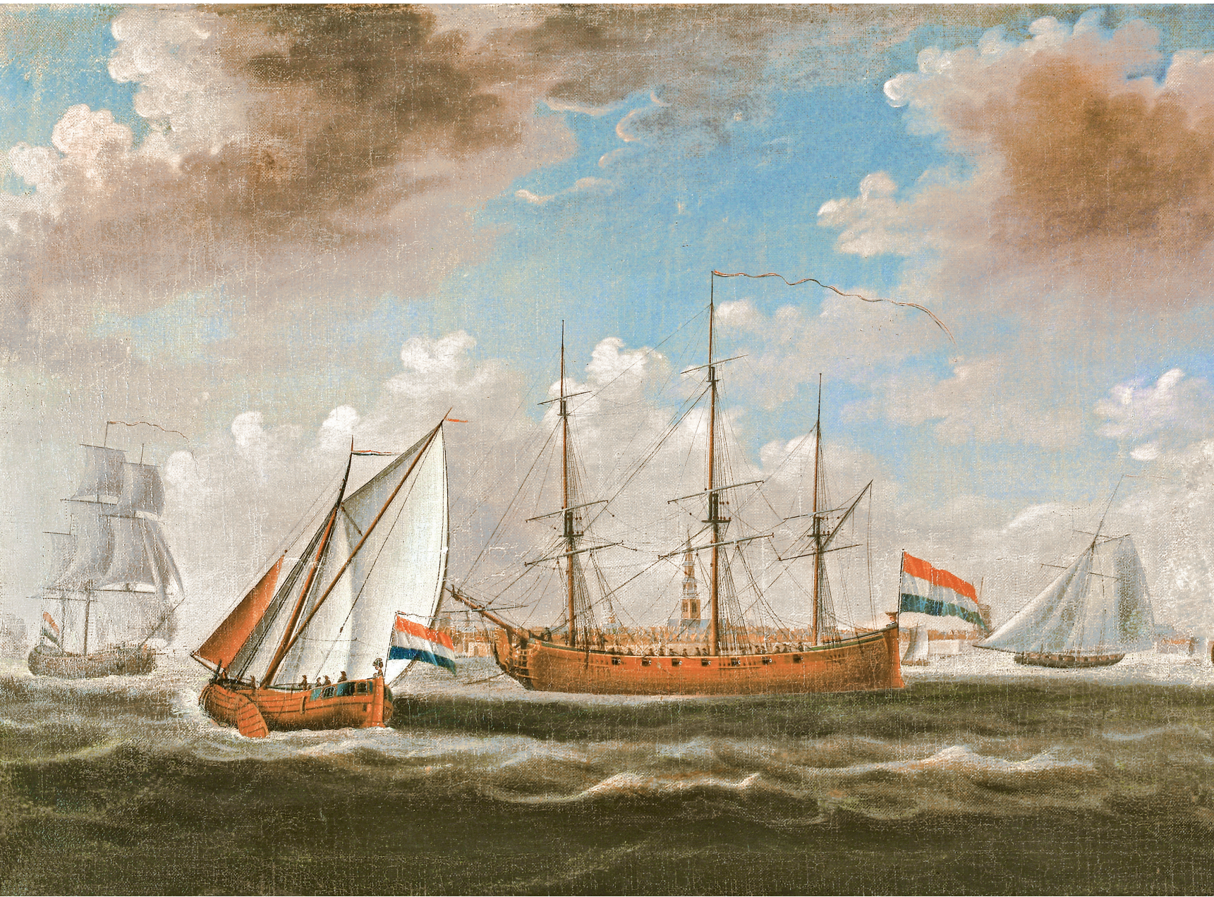
Het hoekerschip Brandenburg , een koter en een jacht op de rede van Vlissingen. De Brandenburg , een van de grootste compagnieschepen van de MCC in de achttiende eeuw, liep in 1780 op de MCC-werf van stapel. Door het uitbreken van de Vierde Engelse Oorlog kon de hoeker pas in 1783 voor de eerste keer uitzeilen. Tot 1794 maakte het schip vier scheepsreizen voor de Compagnie naar Amerika, waarvan één driehoeksreis via West-Afrika. Schilderij van Engel Hoogerheyden, 1779. Zeeuws Maritiem muZEEum, Vlissingen, 1143.