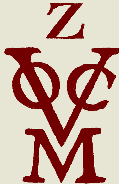
Monogram van de Commercie Compagnie van Middelburg (links) en van de voc kamer Zeeland (rechts).