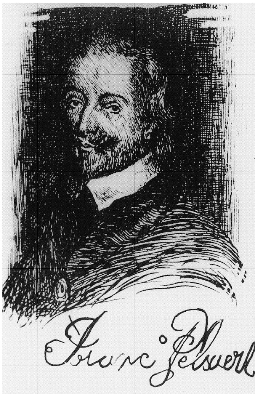
2. Vermeend portret van Fransisco Pelsaert. Uit: Drake-Brockman, Voyage to Disaster , 1964, t.o. p. 78. Ets naar een 17e-eeuwse gravure.