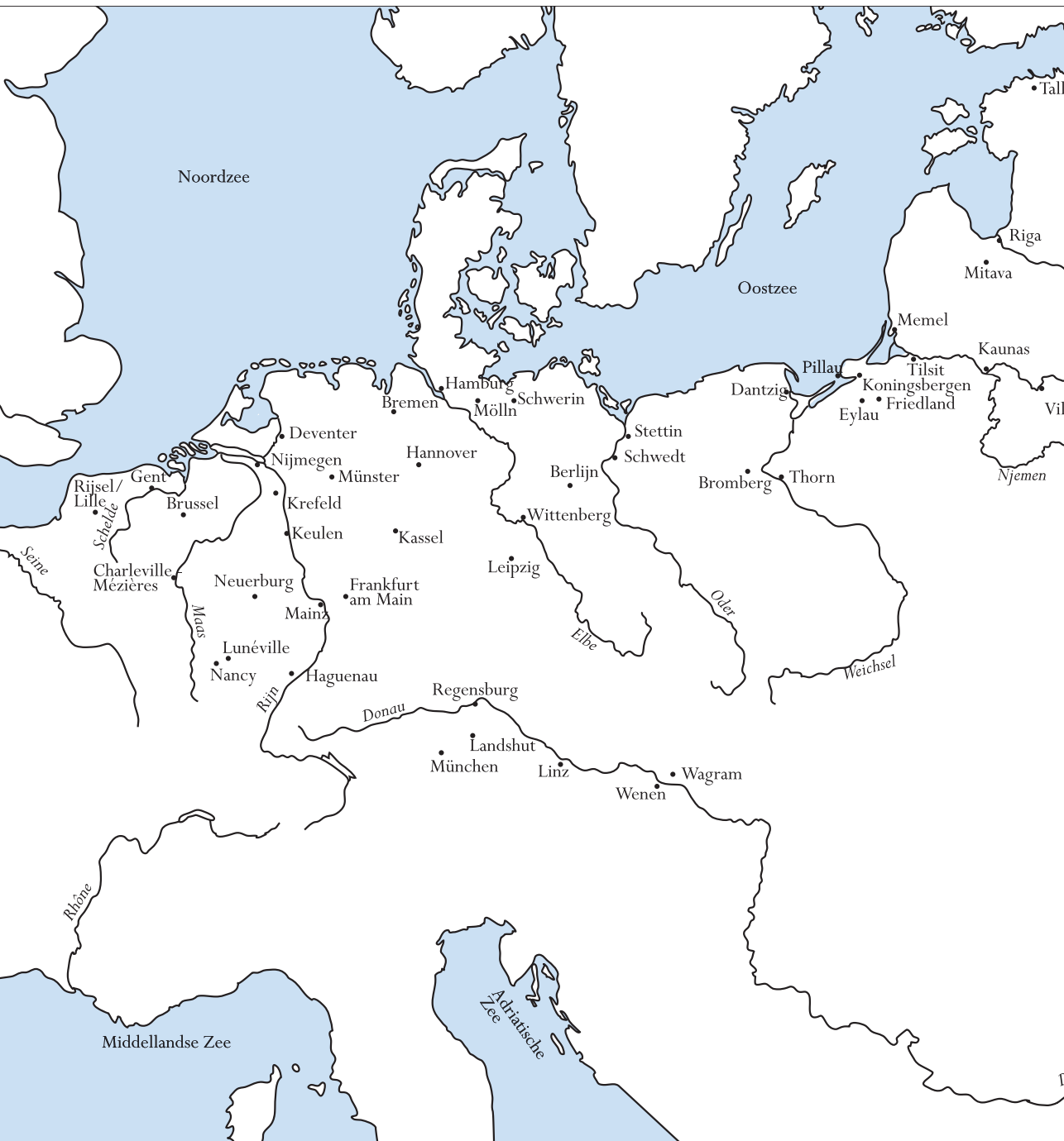
Kaart 1: Overzichtskaart met een aantal plaatsen die Abbeel vermeldt in zijn memoires