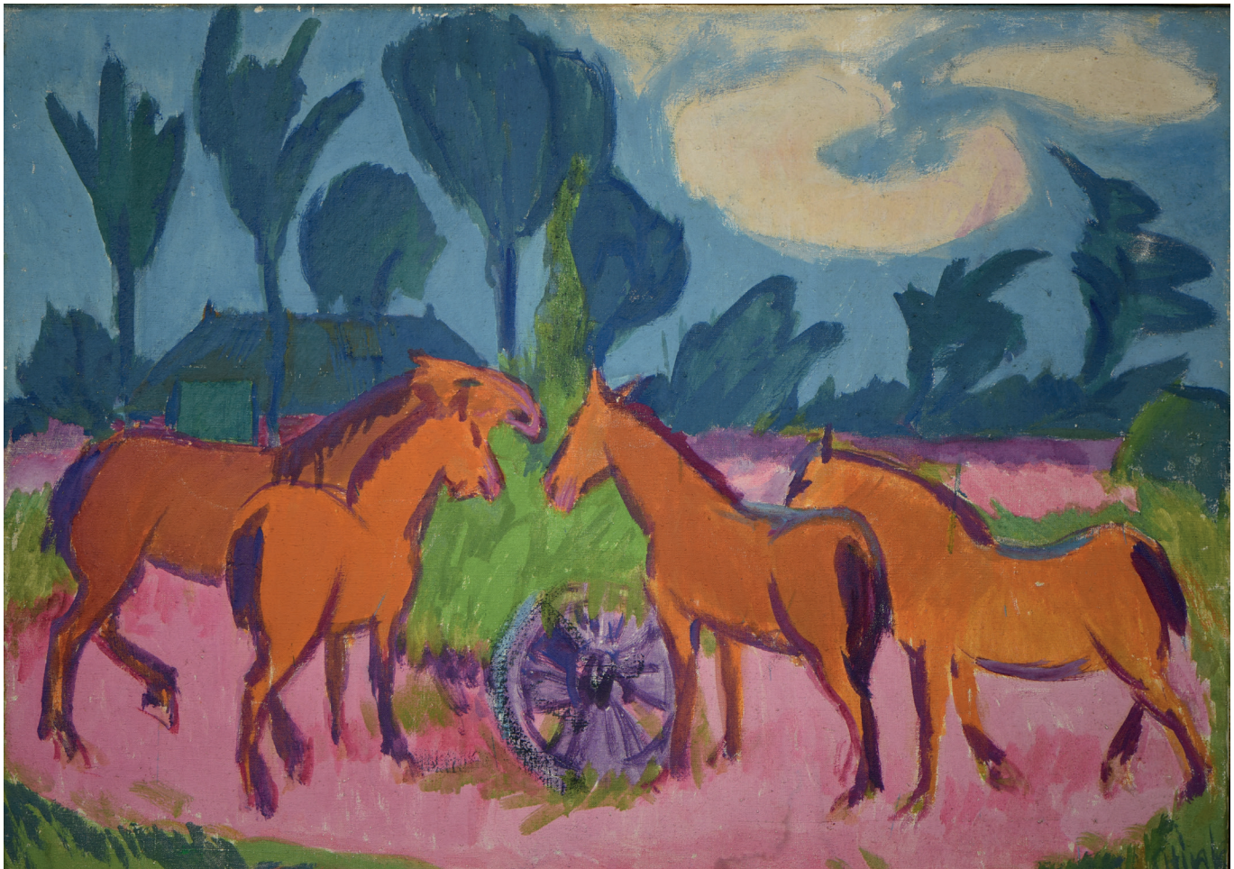
Jan Altink, Vier Paarden, 1925, olieverf op doek, 77 x 100 cm, collectie Museum Belvédère Oranjewoud