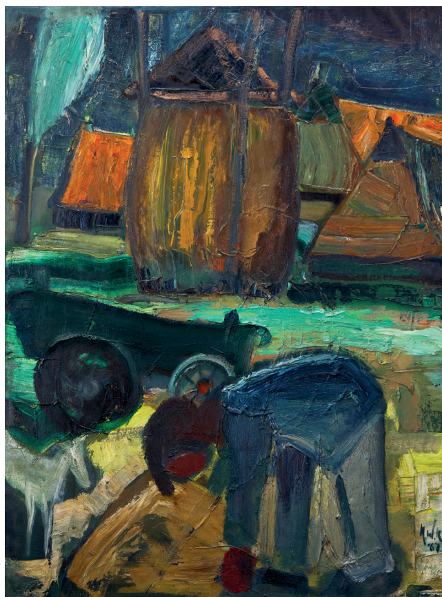
Klaas Koopmans, It ôfskie fan de lytse boer , Garijp 1967, olieverf op doek, 116 x 188 cm, collectie Fam. A. Koning, Leeuwarden > zie ook pag. 153

Rond het geboortjaar van Klaas Koopmans, twee jaar na afloop van de Eerste Wereldoorlog, brak een periode aan die als de Roaring Twenties de geschiedenis is ingegaan. Het was de tijd van de charleston en van de plusfours, maar ook de tijd van grote veranderingen in de beeldende kunst. Veranderingen die begonnen rond 1905 in Dresden met de oprichting van Die Brücke, toen een aantal Duitse kunstenaars definitief brak met de traditionele schilderkunst. Niet langer benaderden die schilders de werkelijkheid direct en visueel, zoals de schilders van Barbizon en na hen de impressionisten (die met licht en sfeer speelden) dat gedaan hadden, maar zoals ze die natuur om zich heen op het moment vanuit hun persoonlijke gevoelens en emoties ervoeren. Hiermee veroorzaakten de oprichters Ernst Ludwig Kirchner, Fritz Bleyl, Erich Heckel en Karl Schmidt-Rottluff een omwenteling in de kunst die resulteerde in