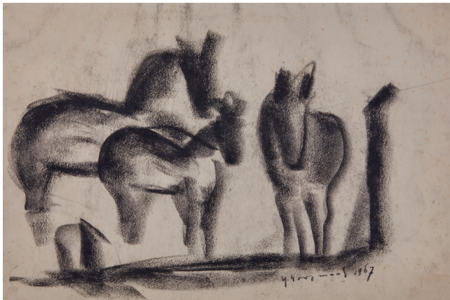
Klaas Koopmans, Drie paarden, Trije hynders, 1967, Siberisch krijt 28 x 39 cm, collectie Fam. S. Bruinsma, Garijpo > zie ook pag. 93

die de ‘nieuwe kunst’ propageerden. Het kunstenaarscollectief zou met het uitbreken van de Eerste Wereldoorlog al ophouden te bestaan. 11