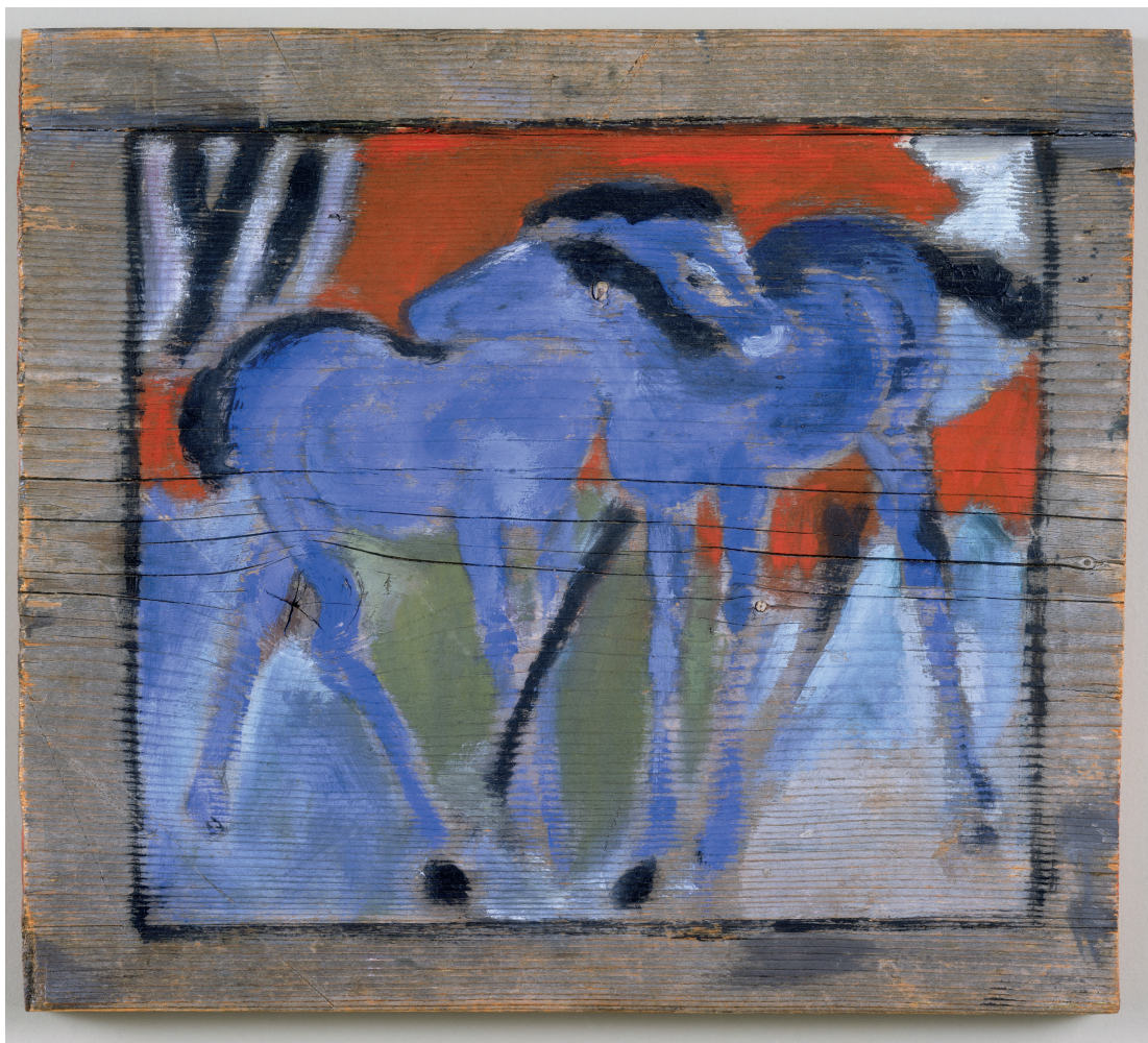
Franz Marc, Blaue Fohlen, 1912, olieverf op paneel, 33 x 37 cm (beeldmaat 27,5 x 31 cm), collectie Stedelijk Museum Amsterdam

In 1912 verscheen het eerste nummer van hun lijfblad met een omslag naar het beroemde ontwerp van Wassily Kandinsky van Der Blaue Reiter, waarbij deze zich liet inspireren door de in de 'Hinterglasmalerei' 10 veelvuldig gebruikte figuur van de bewapende Sint Joris, die te paard gezeten een draak verslaat. In de almanak mochten uitsluitend kunstenaars aan het woord komen