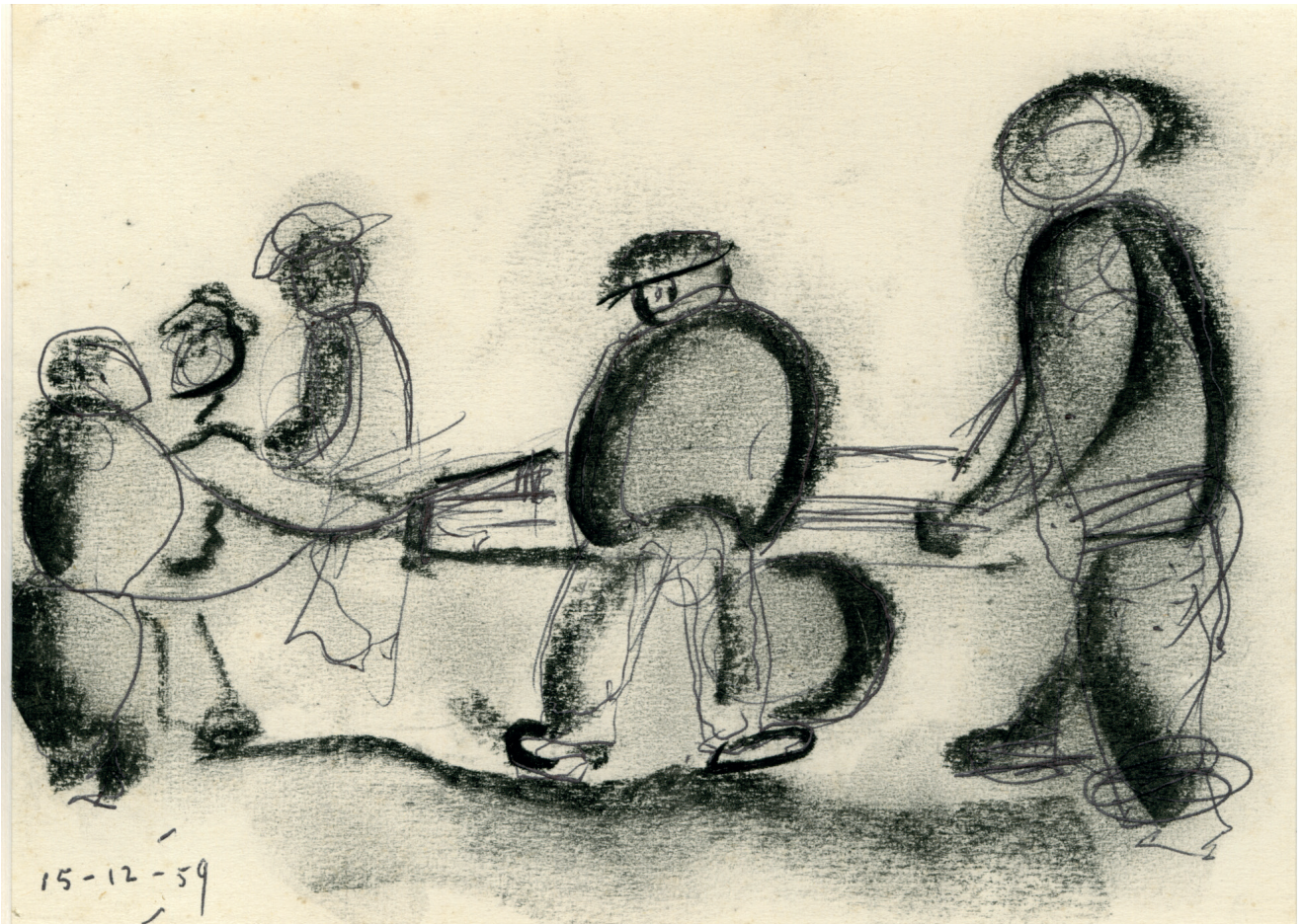
Klaas Koopmans, De transportploeg, Franeker 1959, Siberisch krijt met balpen, 12,5 x 17 cm, collectie Stichting Klaas Koopmans