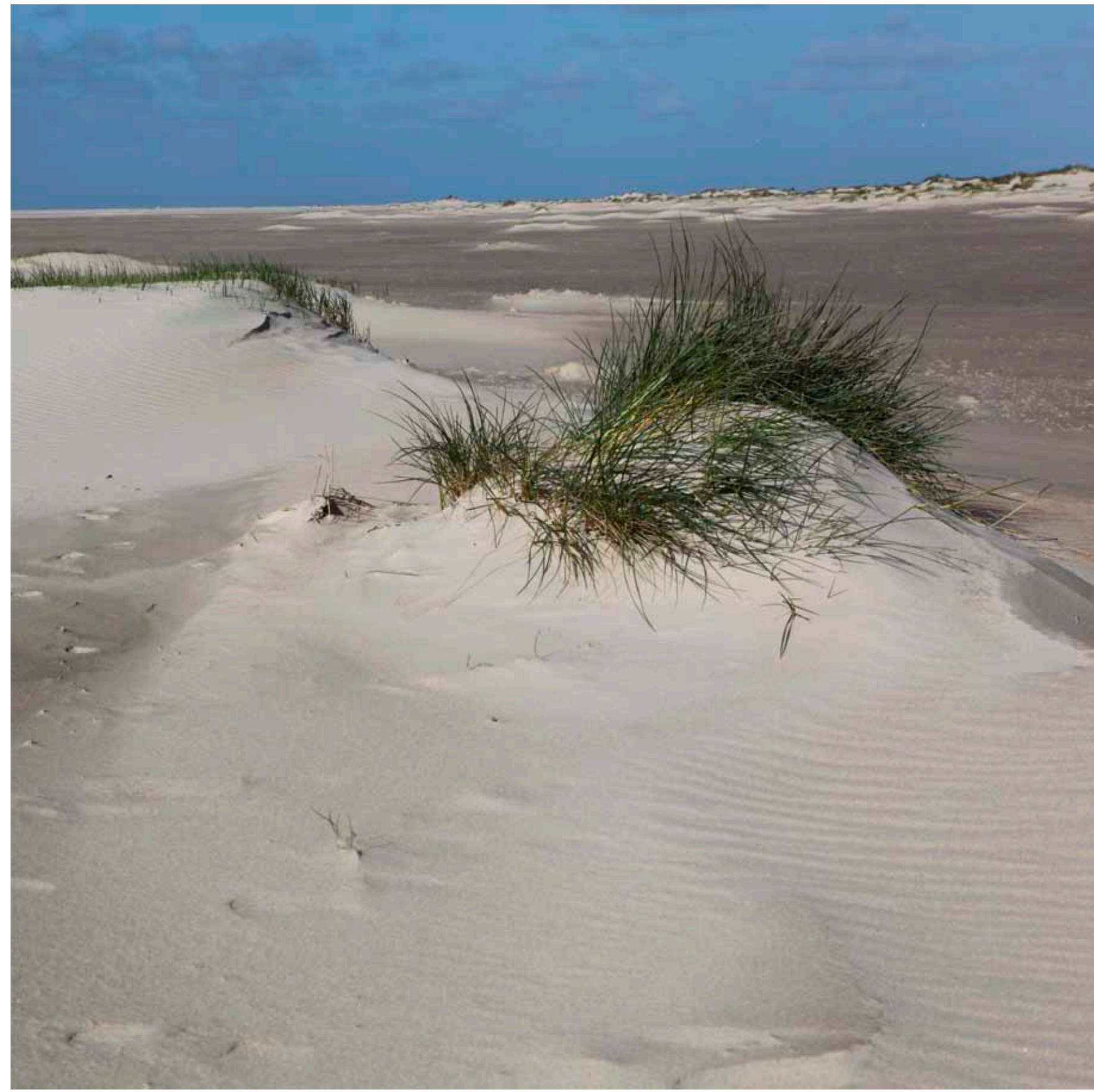
De Hors, zandwoestijn tussen Noordzee en Mokbaai