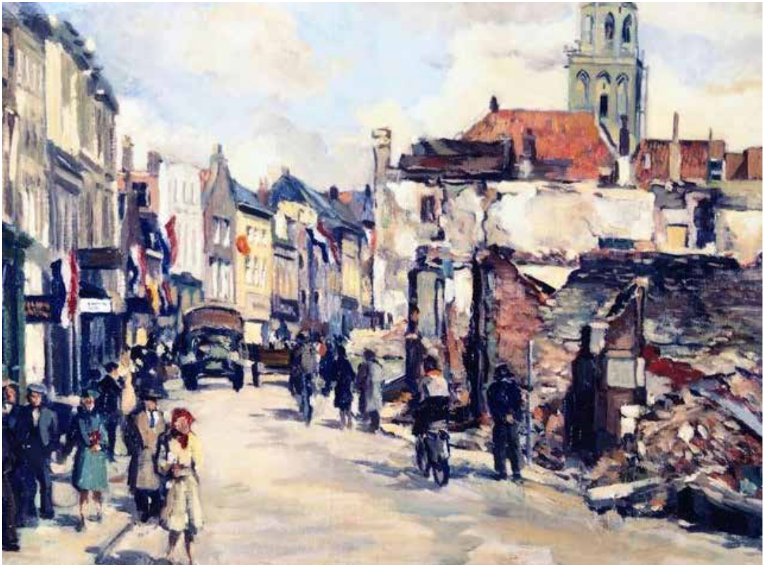
Schilder Max van der Wissel. Verwoestingen in de Oosterstraat.

heeft. Het gevolg: honderden reacties via de mail en de post. Een deel van deze verhalen is in dit boek verwerkt.