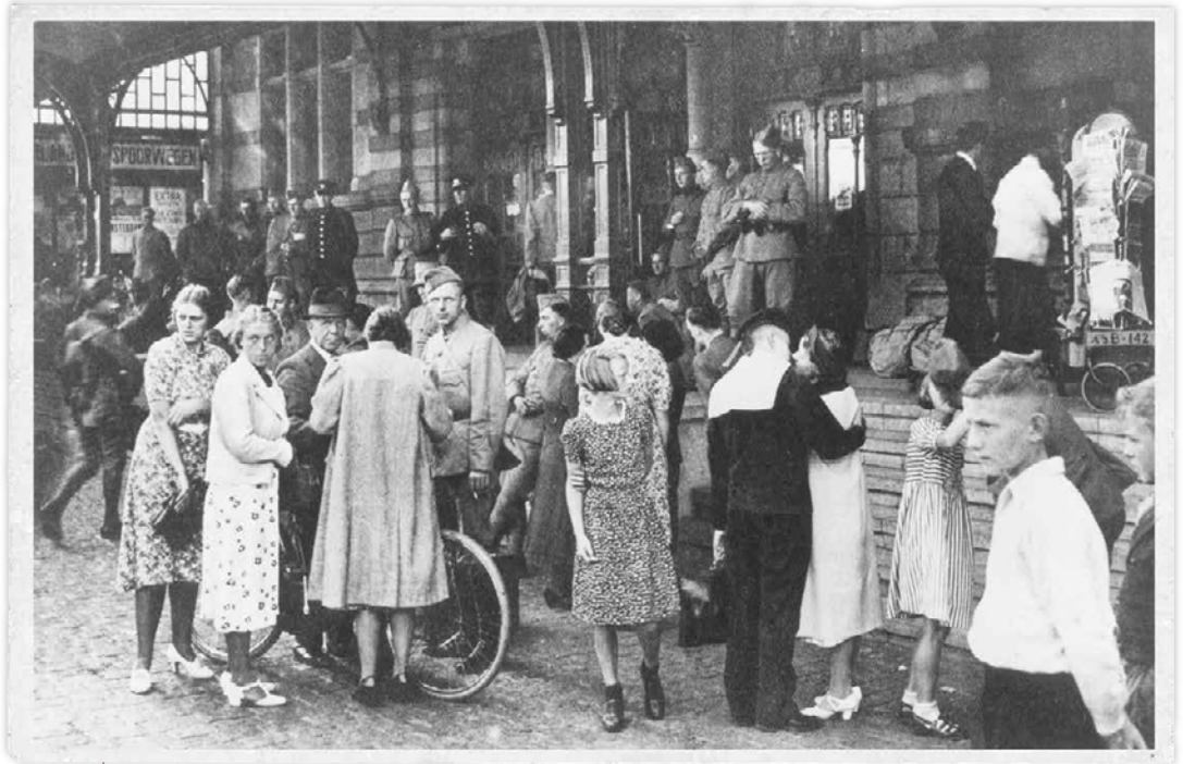
Groningse militairen nemen afscheid van hun geliefden op het hoofdstation in Groningen.