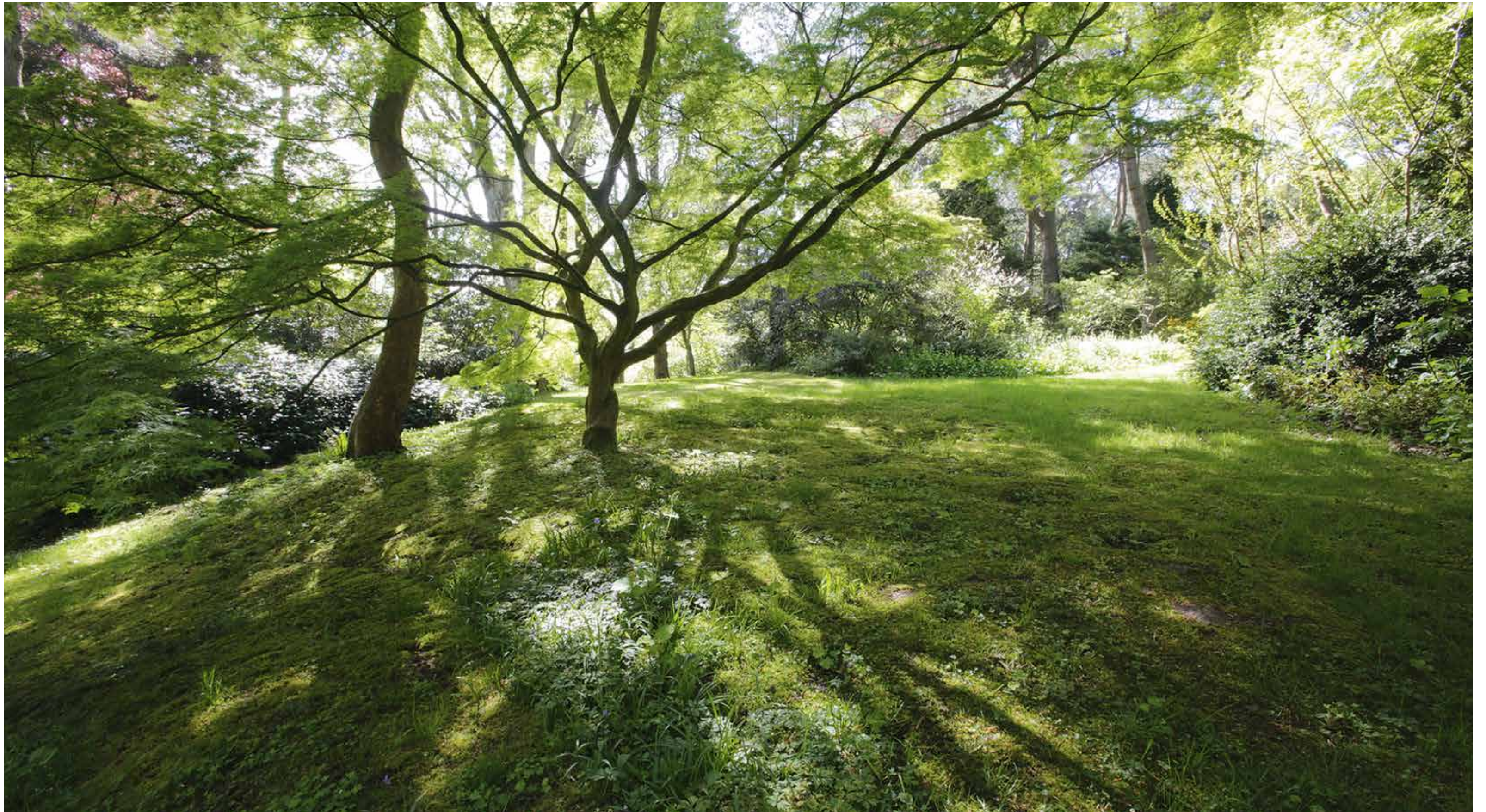
Het licht dat valt door een Japanse esdoorn in Jardin Le Vasterival