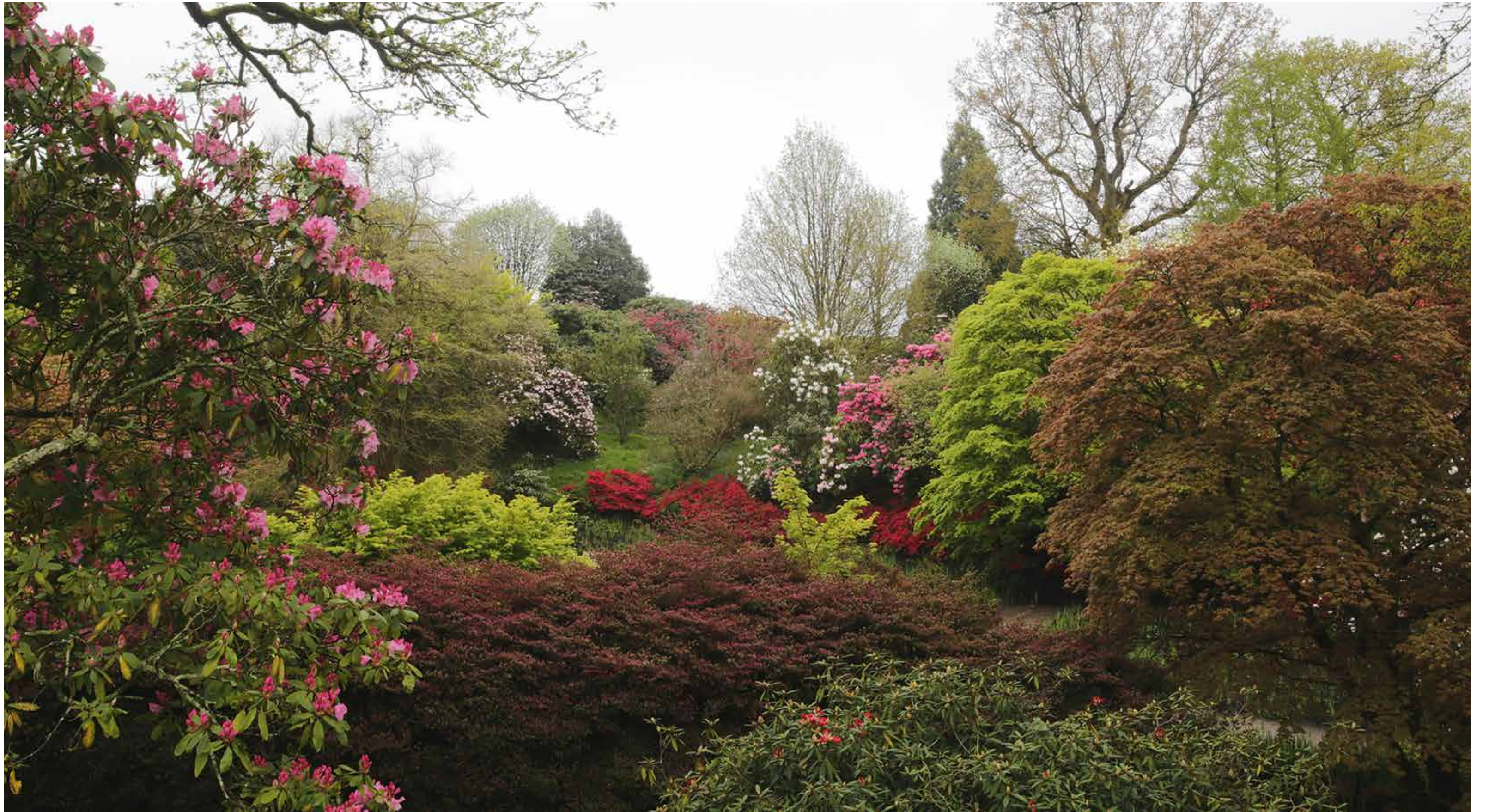
Japanse esdoorn en Rhododendron in een Aziatische voorjaarstuin in Wakehurst