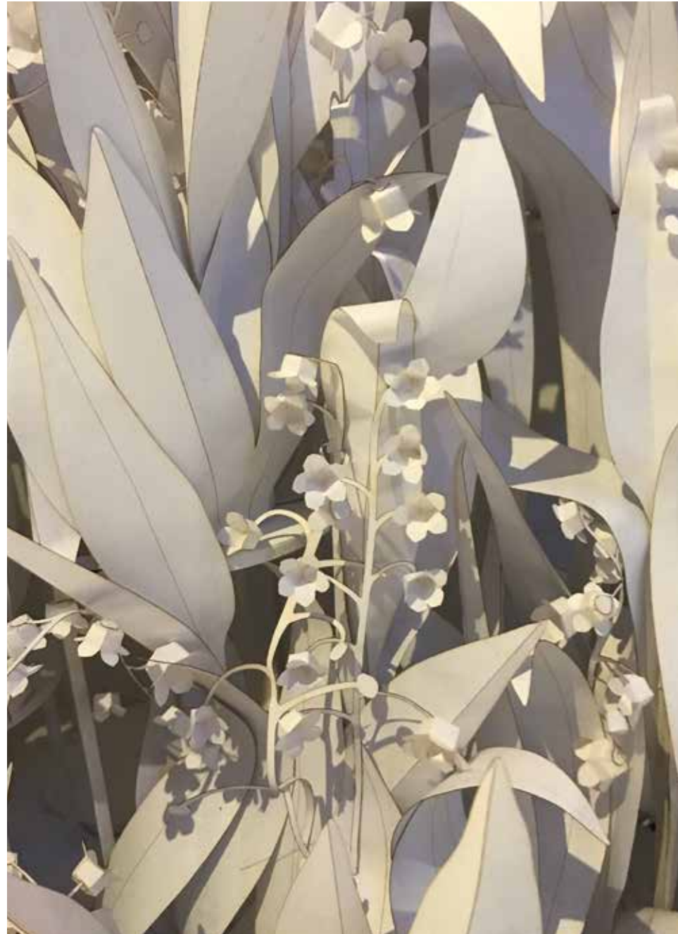
Papieren bloemen door Wanda Barcelona