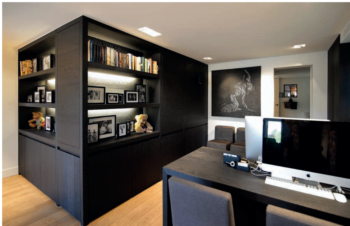
Via de speelruimte aan de straatkant kom je in het huiskantoor. In een kast zit een pluchen beer van wel zeventig jaar oud.