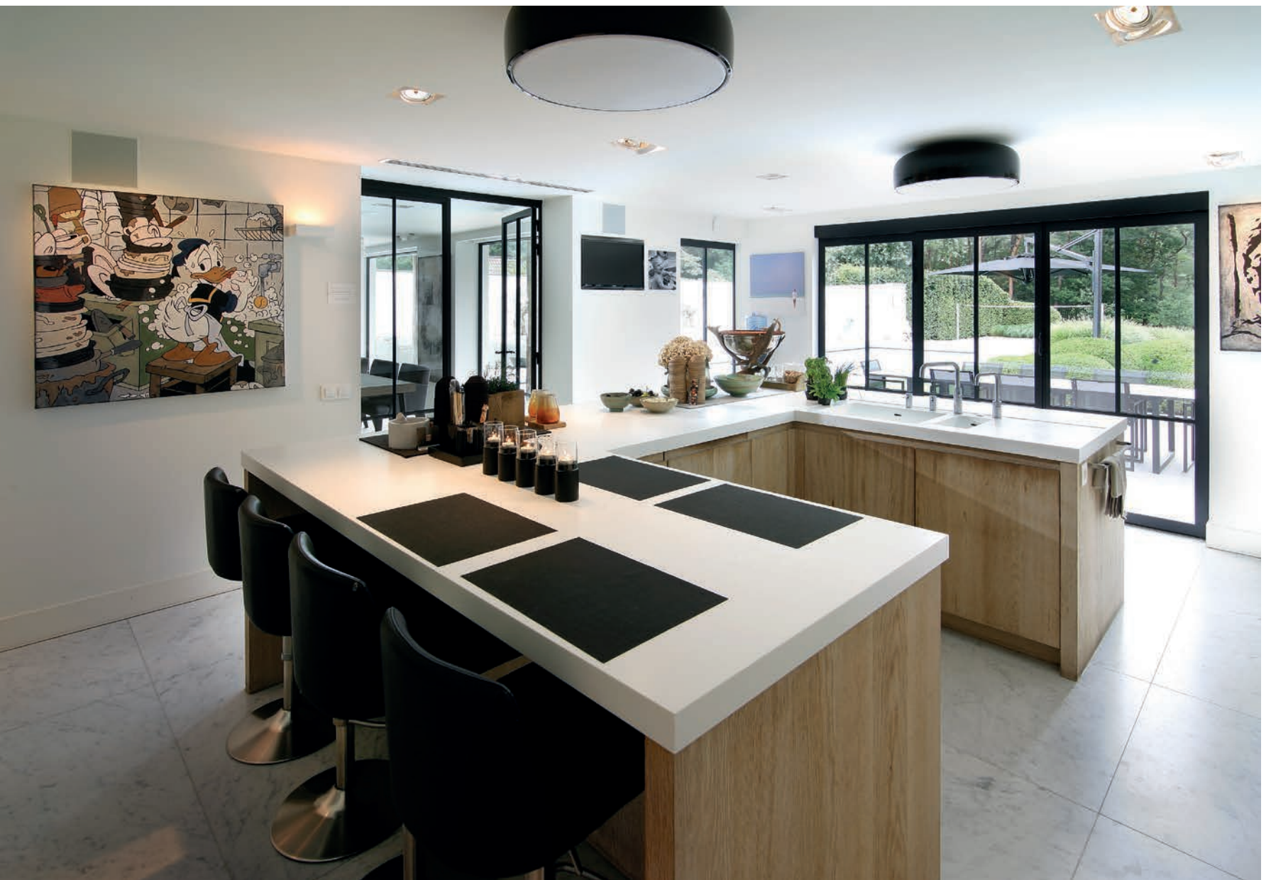
De keuken is een realisatie van Uytterhoeven uit Heist-op-den-Berg.