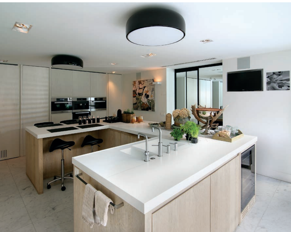
De culinaire ambiance rijst de pan uit en men verheft hier genieten van de kleine dingen tot (levens)kunst.