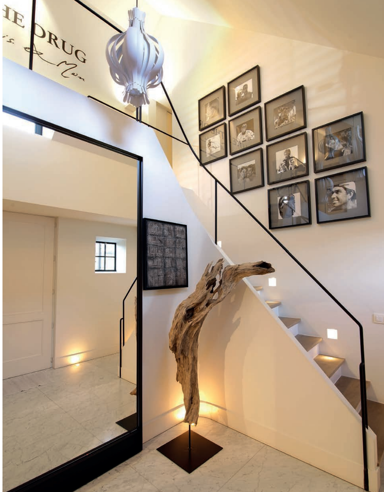
Van Chris' werk in de traphal gaat oerkracht uit. En wat een match toch met het op een voet gestalde drijfhout uit Bosnië!

DE WIND BLAAST DE GRIJZE wolken weg en de zon priemt door het blauw. We bellen aan bij een hoger gelegen villa van een hartelijk koppel dat de kunst verstaat om te genieten van de kleine dingen.