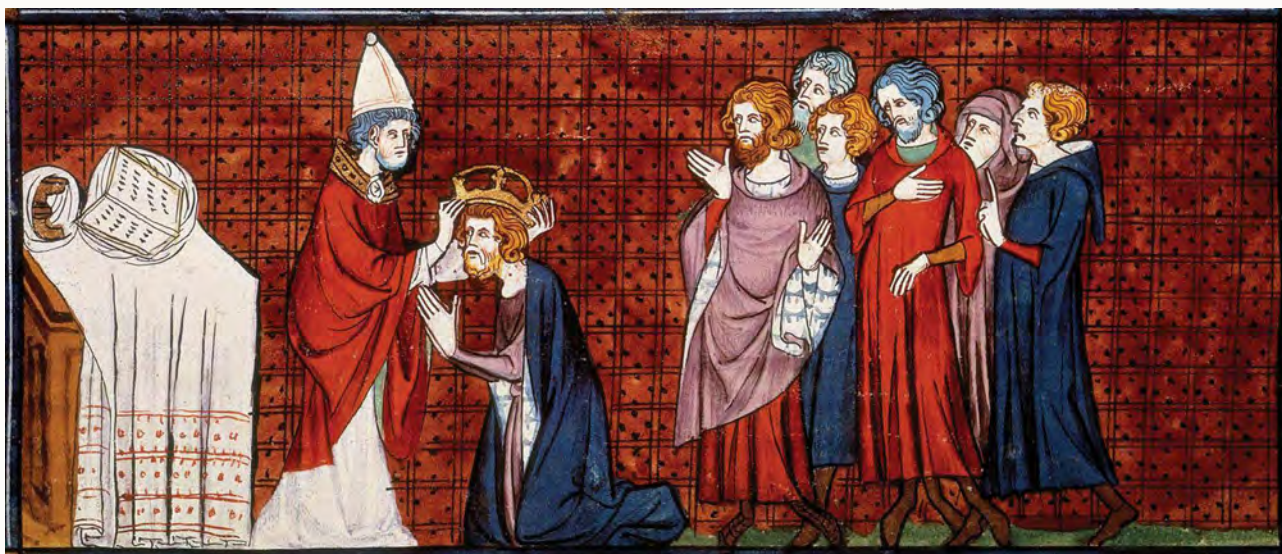
Karel de Grote (ca. 747–814) werd op 25 december 800 door paus Leo III in de oude Sint-Pieterbasiliek tot keizer van het Heilige Roomse Rijk gekroond.

een beslissende wending plaats. De machtigste vorst van het Westen, die over heel de Latijnse christenheid lijkt te heersen, de koning der Franken, wordt vanaf dat moment gezalfd, zoals dat al langere tijd het geval was met de kleine koningen van Noord-Spanje. Dat betekent dat hij zijn charismatische vermogens niet meer ontleende aan zijn mystieke verwantschap met de machten van het heidense pantheon. Nu ontving hij ze via een sacramentele handeling direct van de God van de Bijbel. Priesters zalfden hem met heilige olie die zijn lichaam doortrok en vervulde met de kracht van de Heer en alle machten van het bovenaardse. Een dergelijk ceremonieel maakte de overgang van de macht van de ene dynastie naar de andere mogelijk en tegelijk werd de vorst opgenomen binnen de Kerk, waar hij een plaats kreeg te midden van de bisschoppen die net als hij gewijd waren. Als Rex et sacerdos ontving hij ring en staf, de tekenen van het herdersambt. Met de lofzangen die tijdens de kroningsplechtigheden werden gepalmodieerd nam de Kerk zijn persoon op in de bovennatuurlijke hiërarchieën. Zij bepaalde zijn functie, die nu niet meer alleen de strijd maar ook de vrede en gerechtigheid betrof. En bovenal, omdat in het achtste-eeuwse Westen de op de glorie van Rome teruggaande kunsttradities alleen nog binnen de christelijke Kerk bewaard waren gebleven, omdat