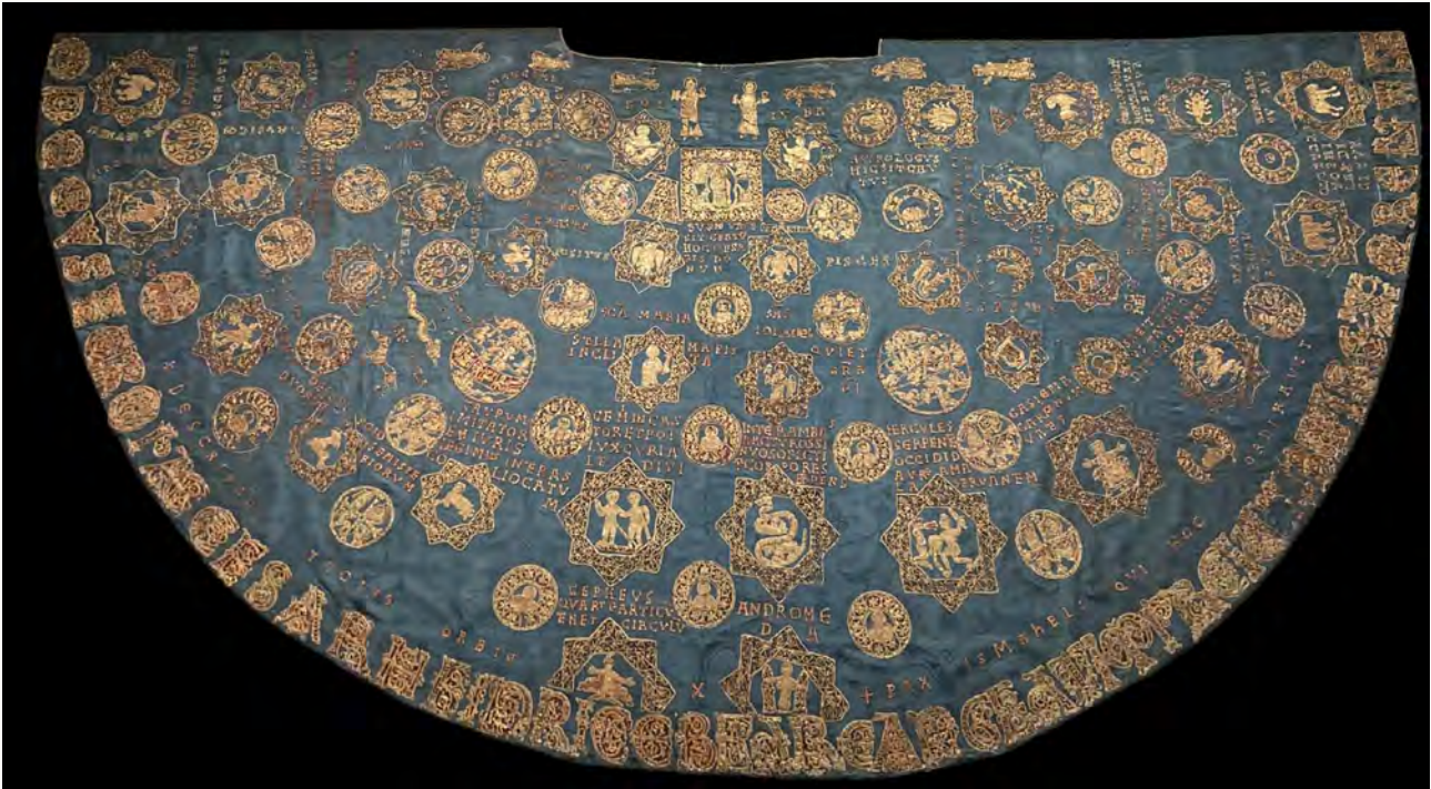
De Sternenmantel van Keizer Hendrik II (973–1024) en een keizerskroon die mogelijk sinds Otto I (912–973) in gebruik is geweest om Rooms-Duitse koningen en keizers te kronen.

lingers eigenhandig vorm hadden gegeven en volledig tot beschaving hadden gebracht, was dat idee altijd duidelijker blijven doorwerken dan elders. Saksen was weliswaar de minst beschaafde van alle Duitse provincies, maar juist daar betoonde het nog jonge christendom zich het krachtigst. De plundersaars die door heel Europa trokken bleven hier weg, omdat het een zeer arme streek was, maar vooral omdat de inwoners ervan zich geducht wisten te verdedigen. In deze ogenschijnlijk door God gezegende wijkplaats zochten de vluchtende monniken met hun relikwieën en hun kennis hun heil.