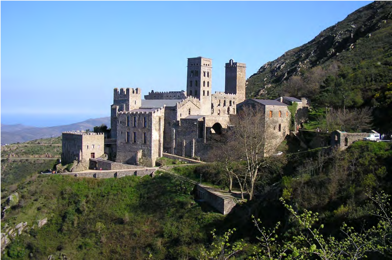
Sant Pere de Rodes, een voormalig benedictijner klooster uit waarschijnlijk de tiende eeuw, gelegen in het noorden van Catalonië, heeft kenmerken van de Mozarabische kunststijl als gevolg van de Moorse bezetting van het Iberisch schiereiland vanaf 711.

tenschap van de verschillende volksstammen die in de vroege middeleeuwen hier en daar in het Westen waren neergestreken. In de namen van landen als Lombardije, Bourgondië, Gascogne en Saksen klinken ze nog door. De herinnering aan oude veroveraars hield bij de aristocratie van deze provincies een nationaal bewustzijn en vreemdelingenhaat wakker als gevolg waarvan de Bourgondiër Rodulfus Glaber vol verachting kon neerzien op de Aquitaniërs van wie hij ooit een troep voorbij had zien trekken, aanstootgevend gekleed en aanstootgevend vrolijk, als begeleiders van een verloofde prinses op weg naar een koning in het noorden. In heel deze warrige geografie verdienen de grensgebieden waar de verschillende cultuurzones op elkaar stootten echter onze eerste aandacht. Dat zijn bij uitstek de gebieden waarop confrontaties en wederzijdse beïnvloeding plaatsvinden en nieuwe ervaringen worden opgedaan. En dus zijn het ook uit-