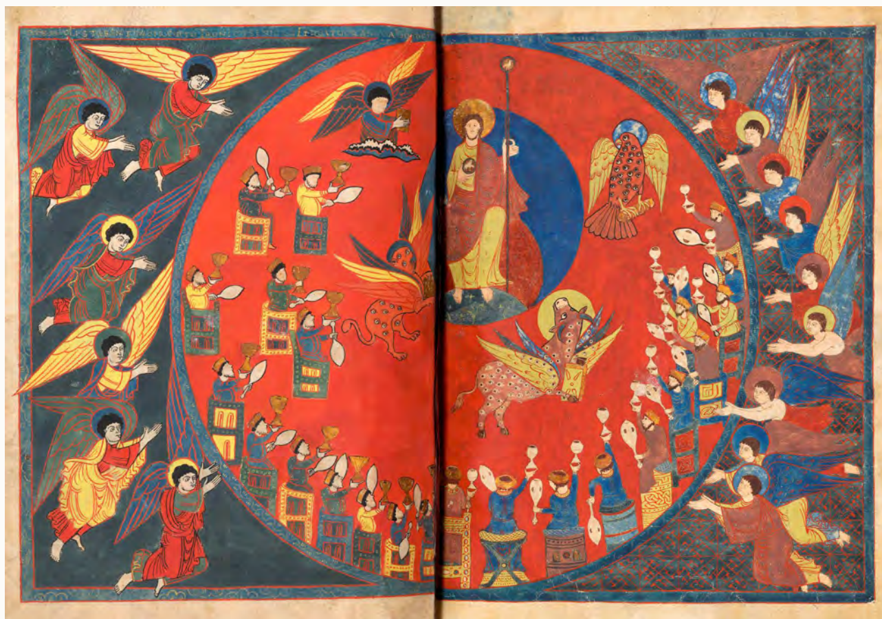
De Apocalyps van Saint-Sever , een romaans handschrift uit het midden van de elfde eeuw, gemaakt in de abdij van Saint-Sever.

hof en vertrokken direct weer om elders een heiligdom te bezoeken of een militaire expeditie te ondernemen. Ze waren steevast onderweg, altijd te paard, en onderbraken hun omzwervingen alleen voor korte tijd in het holst van het regenseizoen. De allerzwaarste ontzegging die monniken zich moesten getroosten was misschien wel hun opsluiting in een klooster, voor altijd. Velen hielden dat niet vol, dus moesten ook zij kunnen dwalen, van woonstee veranderen, rondzwerfen van abdij naar abdij. En heel deze mobiliteit van de kleine groep bevoorrecht van wie de kunstproductie afhing, werkte nieuwe contacten en ontmoetingen in de hand.