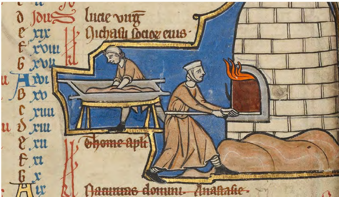
Een illustratie in een Belgisch psalterium uit de dertiende eeuw toont het bakken van brood.

Overdreven ze, toen ze spraken van opgestapelde lijken in massagraven, uitgehongerde benden die grond aten en soms zelfs de doden opgroeven? Al deze schrijvers waren mannen van de Kerk. Van heel die ellende, of van de inheemse ziekten die het kwetsbare volk langzaam decimeerden en de sterftcijfers soms heftig konden opstuwten, deden zij zo nauwgezet verslag omdat dergelijke rampen voor hen zowel de armzaligheid van de mens als het overwicht van God tot uitdrukking brachten. Het hele jaar door genoeg te eten hebben gold als een exorbitante luxe, het voorrecht van een paar edelen, een paar priesters, een paar monniken. Alle anderen vielen ten prooi aan de honger, die zij ondergingen als iets wat nu eenmaal bij het leven hoort. Ontberingen, zo meenden ze, zijn eigen aan de natuur van de mens, zo naakt als hij zich voelt, gespeend van alles, overgeleverd aan dood, kwaad en verschrikkingen. Omdat hij een zondaar is. Sinds de val van Adam wordt hij door honger gekweld; net als van de erfzonde is niemand daar vrij van. Deze wereld leefde in angst, allereerst voor haar eigen zwakheid.