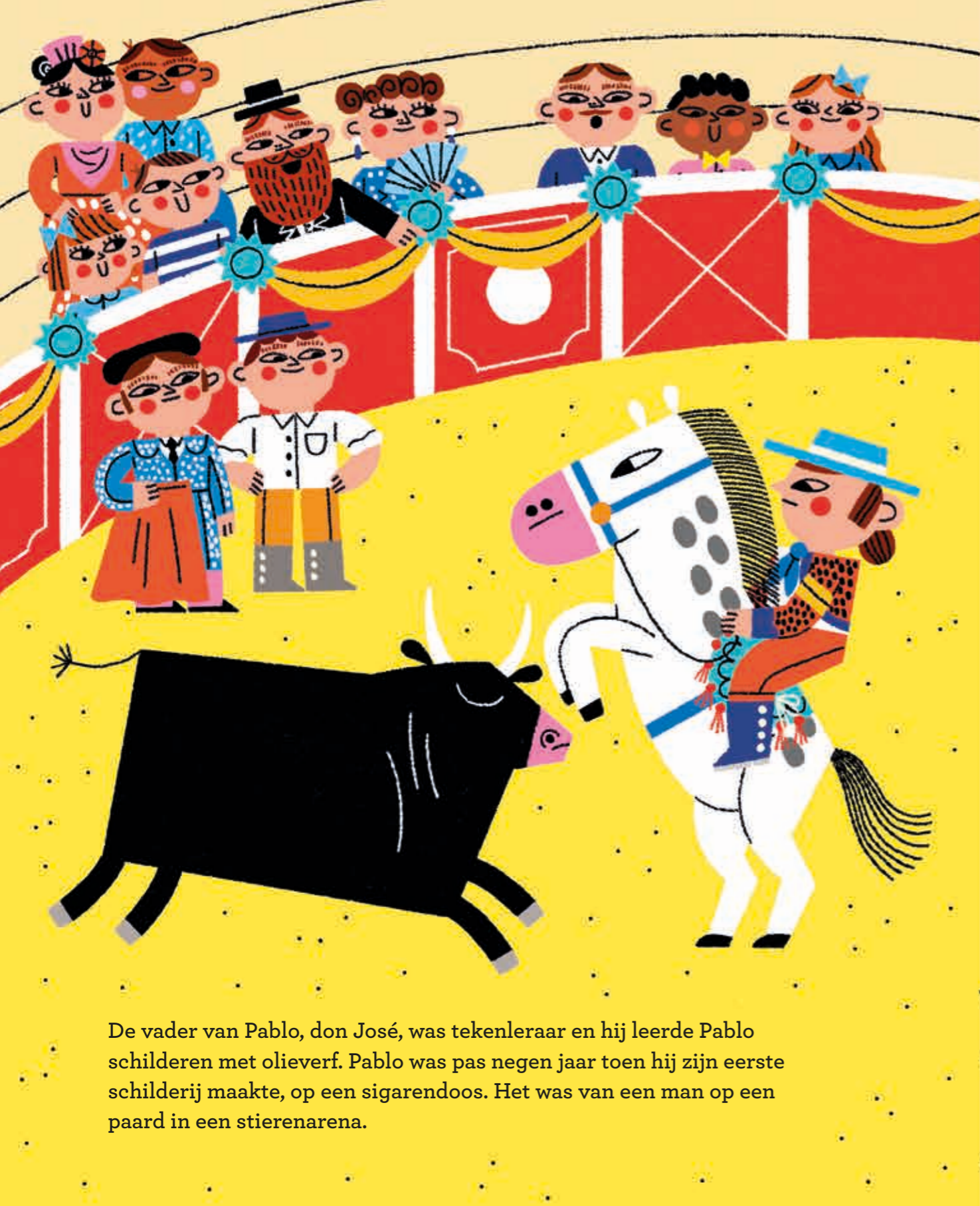
De vader van Pablo, don José, was tekenleraar en hij leerde Pablo schilderen met olieverf. Pablo was pas negen jaar toen hij zijn eerste schilderij maakte, op een sigarendoos. Het was van een man op een paard in een stierenarena.

Hij was nog maar een kind, maar hij kon al beter schilderen dan zijn vader!