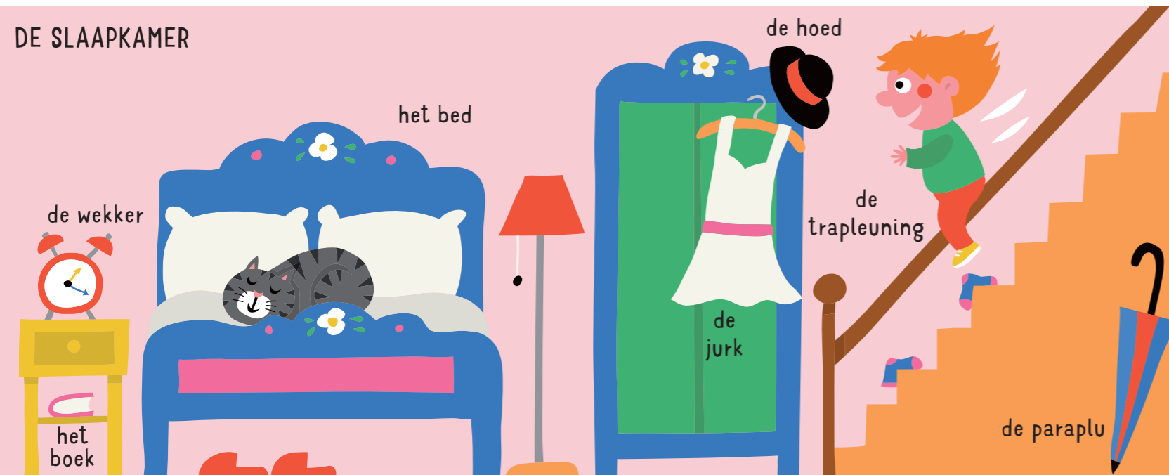
de wekker het boek het nachtkastje de pantoffels de lamp de kast de hoed de jurk de trapleuning de paraplu het bed