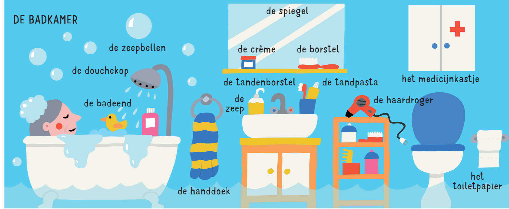
de spiegel de crème de borstel de tandenborstel de tandpasta het medicijnkastje de zeepbellen de douchekop de badeend de zeep de handdoek de haardroger het toilet het toiletpapier