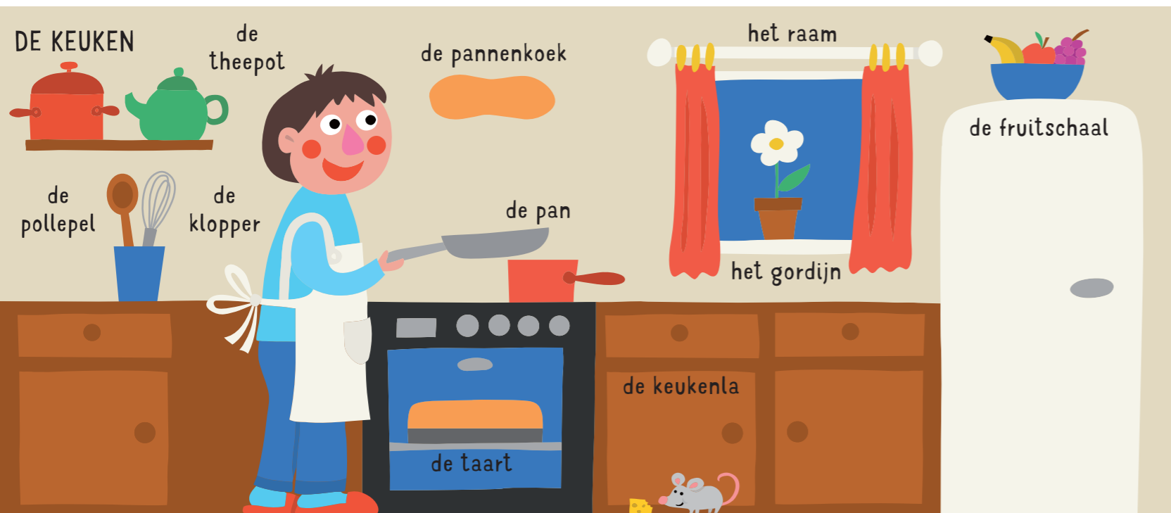
de theepot de pannenkoek het raam de fruitschaal de pollepel de klopper de pan het gordijn de keukenla de taart de oven de koelkast