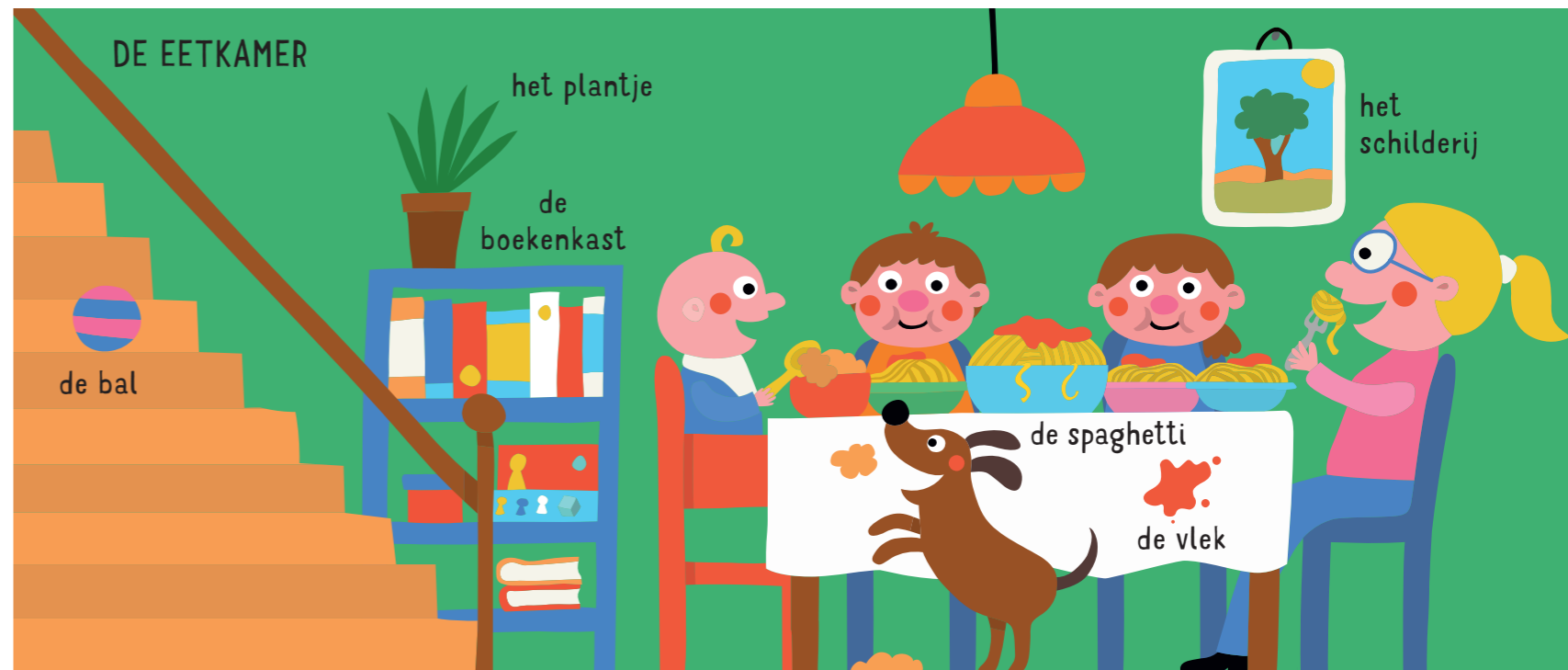
de bal de trap de kinderstoel de tafel de stoel het plantje de boekenkast de spaghetti de vlek het schilderij