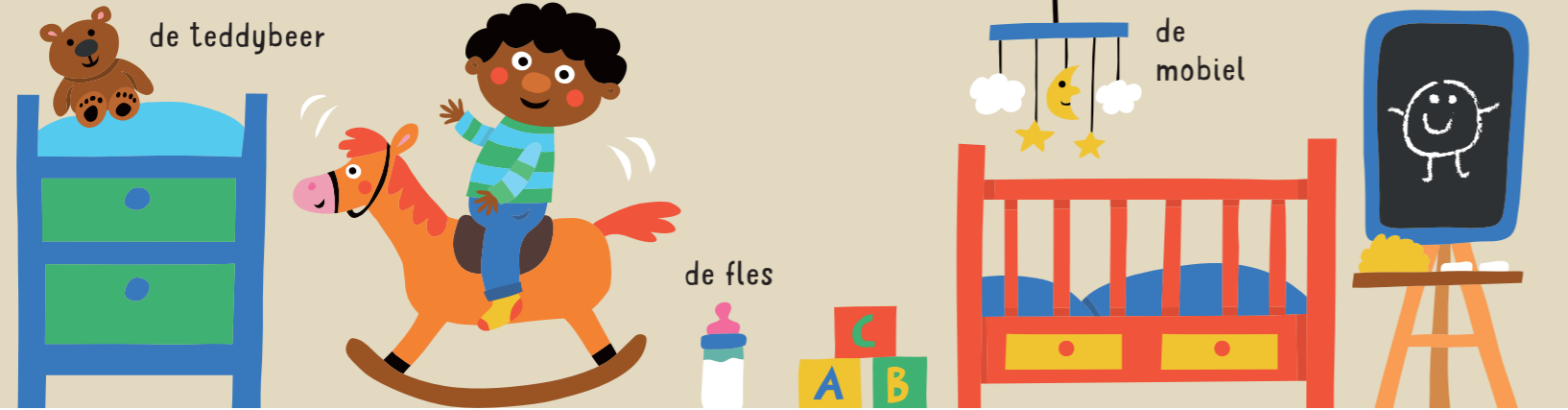
de teddybeer het kastje het hobbelpaard de fles de blokken het kinderbed het tafeltje de wereldbol de speelgoedauto de trein de mobiel het bord