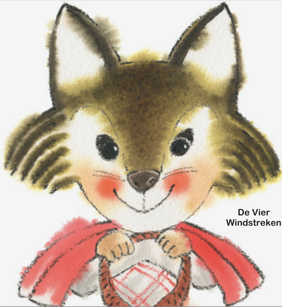
De Vier Windstreken