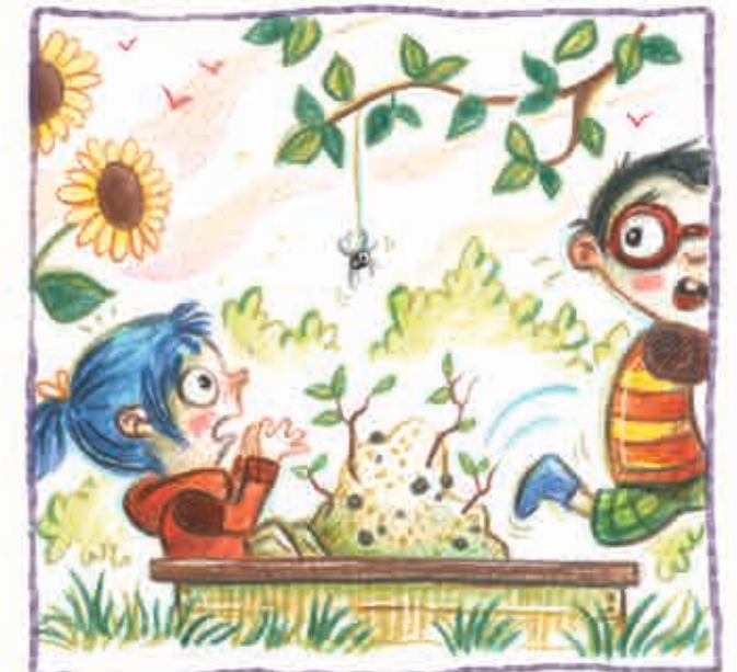
en natuurlijk buiten.

Heb je ze allemaal gevonden? In deze tekeningen zitten 10 spinnen verstopt!