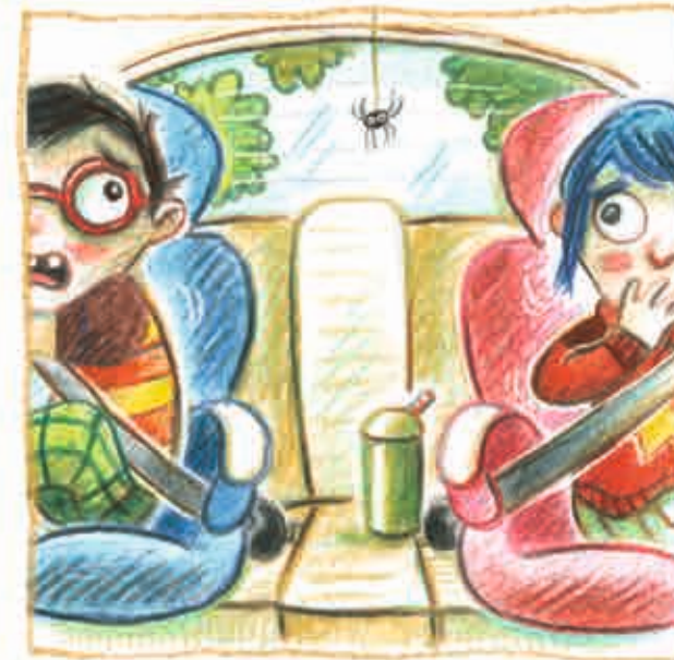
soms zelfs in de auto