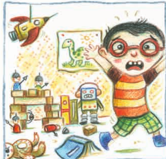
in pikdonkere hoekjes,