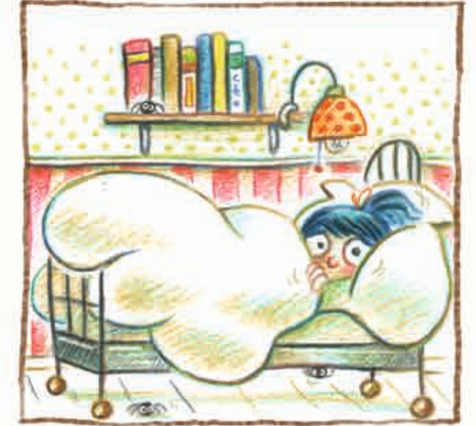
op, onder en naast je bed,