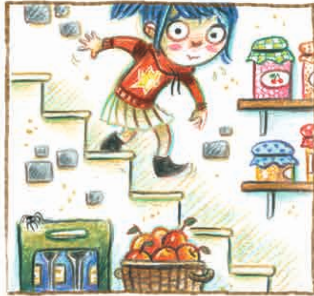
in de kelder,