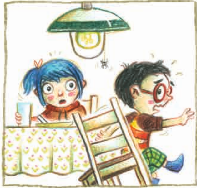
... in de keuken,