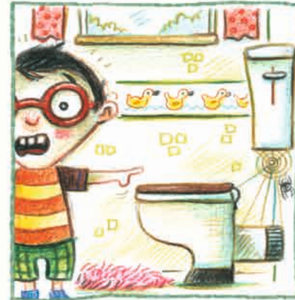
in gewone hoekjes,