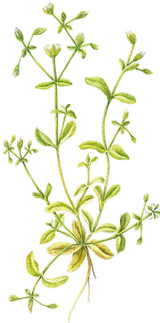
Zandhoornbloem ( Cerastium semidecandrum ) MARIANNE VAN DER STEE