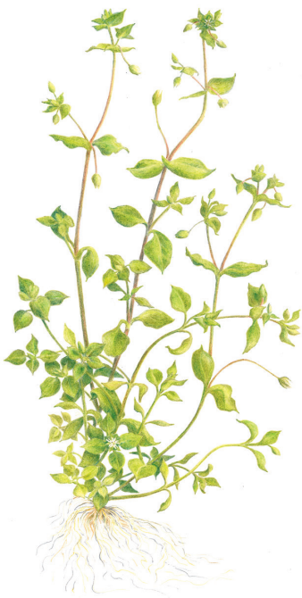
Vogelmuur ( Stellaria media ) NETTIE WILDEROM