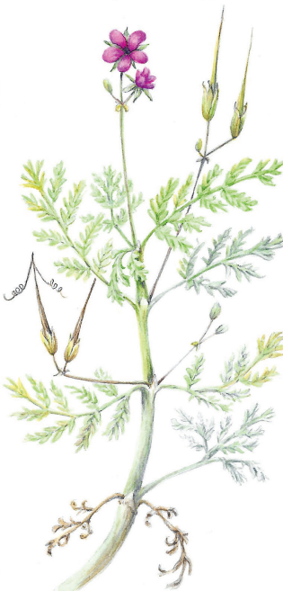
Gewone reigersbek ( Erodium cicutarium ) MARIANNE VAN DER STEE