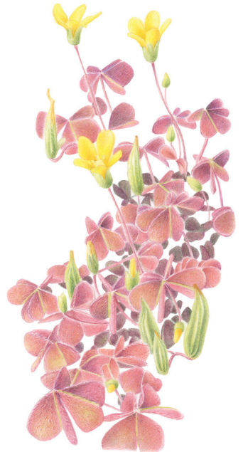
Gehoornde klaverzuring ( Oxalis corniculata ) MARTINE OOSTEROM