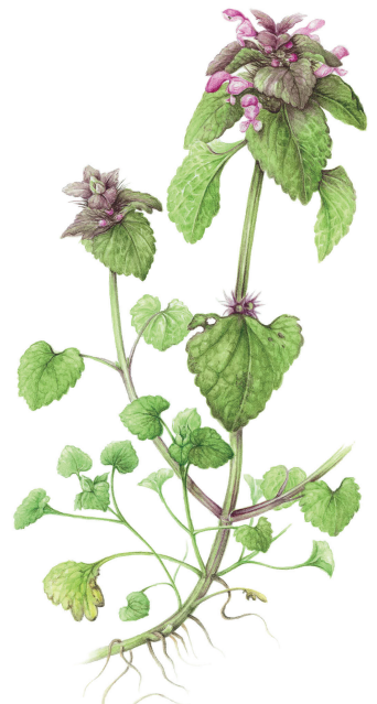
Paarse dovenetel ( Lamium purpureum ) MARGRIET HONINGH