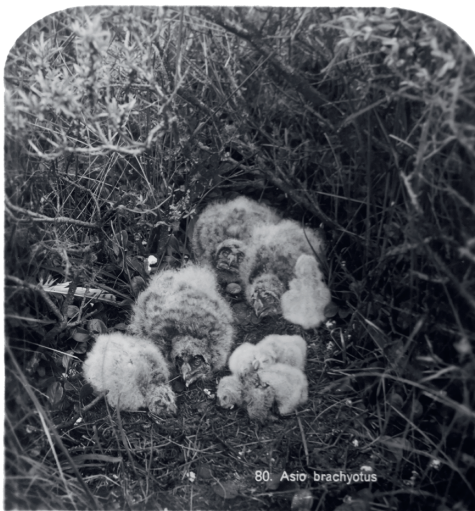
Stereofoto's van Burdet. Boven Kluut op nest, onder jongen van Ransuil in grondnest