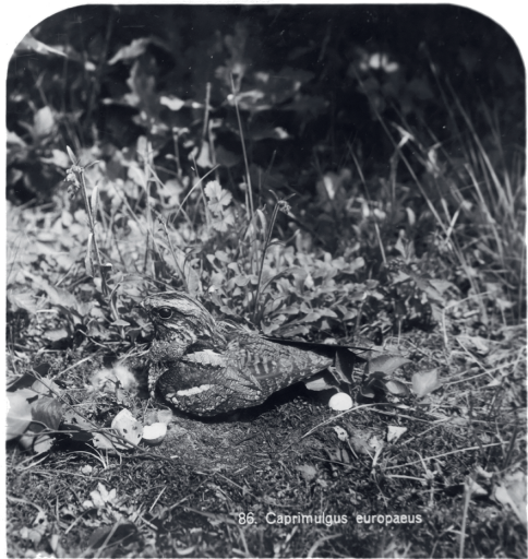
Stereofoto's van Burdet. Boven jonge Sperwers in hun nest, onder Nachtzwaluw op nest