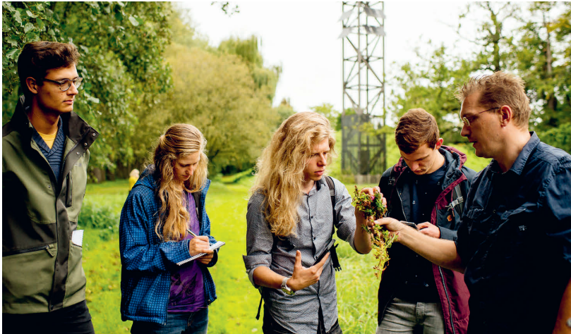
Studenten Bos- en Natuurbeheer van Hogeschool Van Hall Larenstein.

Ofschoon mijn levenspad een gedwongen bocht maakte, bleef het bos altijd trekken. Een jaar of tien geleden was het de Nederlandse literatuur die mij steeds nadrukkelijker op het spoor van het landschap bracht. Ik schreef erover in boeken en tijdschriften. Inmiddels was ik woonachtig in de zuidwestelijke punt van de Veluwe, waar ik bij het verkennen van mijn onderwerpen steeds vaker met boswachters te maken kreeg. Toen een jaar of drie geleden het tijdschrift Hollands Glorie mij vroeg voor de rubriek 'De boswachter', leek ik mijn bestemming toch te hebben gevonden. Sindsdien trek ik elke twee maanden met een boswachter eropuit, het liefst in een deel van Nederland dat ik nauwelijks ken. Tijdens deze wandelgesprekken praat ik met hen over de ontwikkelingen in hun natuurgebied en over het pad dat ze hebben afgelegd om hun droombaan te verwezenlijken. In het vroege voorjaar van 2021, toen mensen vanwege corona meer dan ooit uit wandelen gingen, de druk op veel natuurgebieden enorm toenam en boswachters vaker werden geconfronteerd met de keerzijde van hun mooie vak, besloot ik een stap sneller te gaan lopen en met nog meer boswachters uit wandelen te gaan. Het resultaat hebt u in handen: Het pad van de boswachter. Wandelgesprekken over een droombaan.