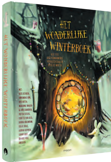
Het wonderlijke winterboek