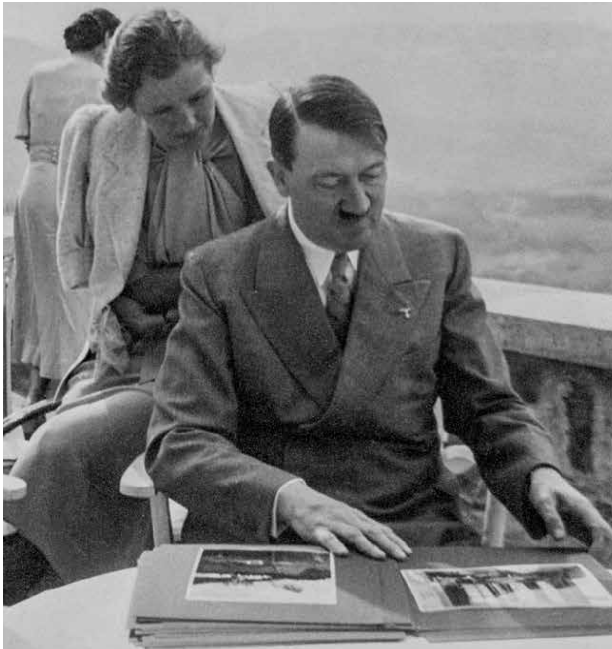
Berchtesgaden, 16 mei 1937. Op het terras van de Berghof op de Obersalzberg bekijken Hitler en Eva Braun een album met losse fotobladen.