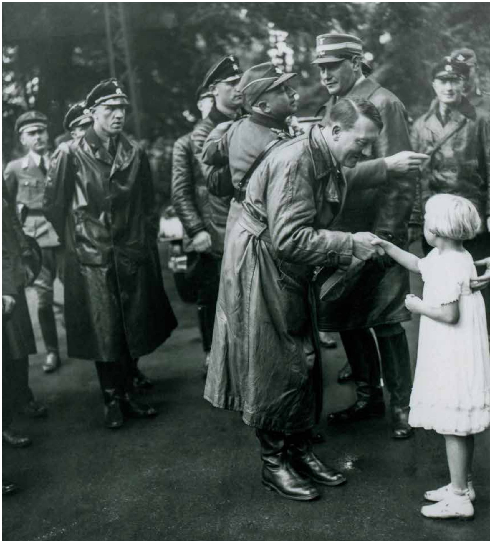
Lünen, Noordrijn-Westfalen, 29 juni 1934. Hitler bezoekt een opleidingskamp van de Reichsarbeitsdienst (RAD).