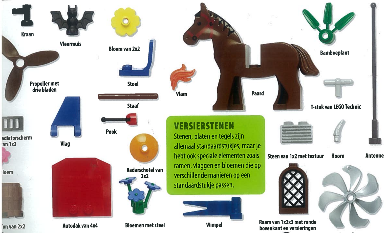
Kraan Vleermuis Bloem van 2x2 Propeller met drie bladen Radiatorscherm van 1x2 Hoem Ton van 2x2