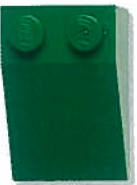
Dakpan van 2x3