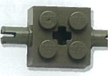
Steen van 2x2 met zijpinnen en gat voor as