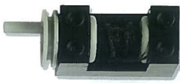
Lier van 2x4