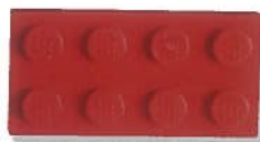
Steen van 2x4