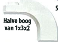
Halve boog van 1x3x2