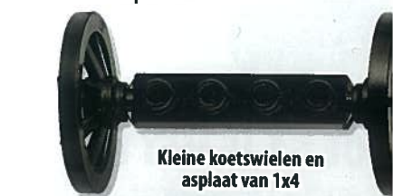
Kleine koetswielen en asplaat van 1x4