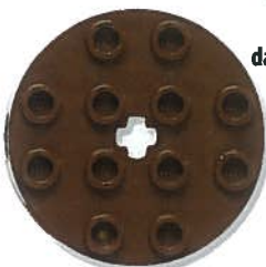
Ronde steen van 4x4