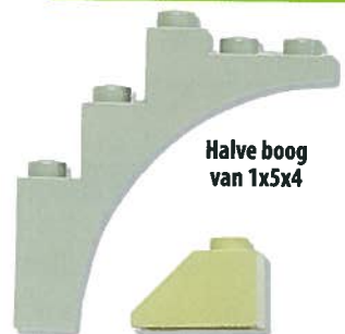
Halve boog van 1x5x4