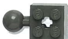
Steen van 2x2 met koppellement