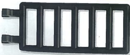
Ladder met twee klemmen

Met bewegende onderdelen komen je LEGO modellen pas echt tot leven. Maak daarbij gebruik van verbindingselementen van LEGO® Technic of gewone stenen, zoals een draaischijf, een scharnier of een lier.