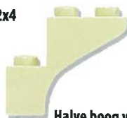
Halve boog van 1x3x2