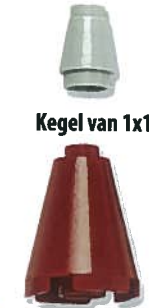
Kegel van 1x1