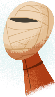
De vrouw in het verband