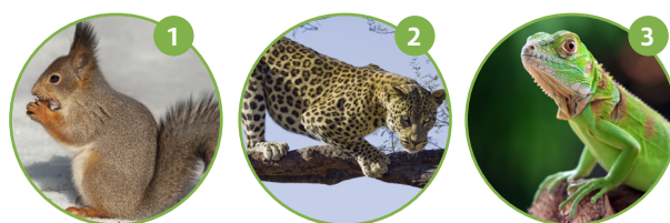
roofdier • reptiel • knaagdier

Zet het diersoort en de nummers van het plaatje voor de juiste informatie.