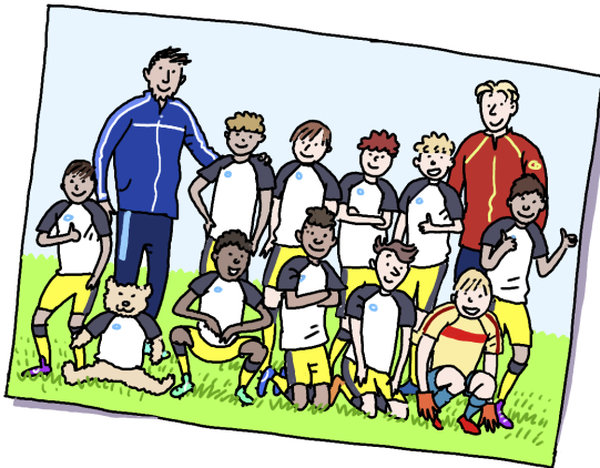
team (spreek uit: tiem )