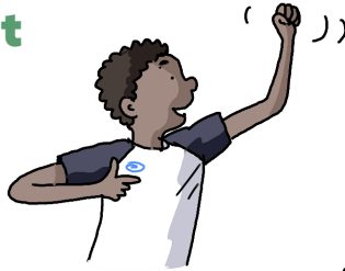
Abu (bijnaam: Orkaan)