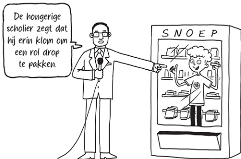
Tekening van snoepautomaat-incident

ben een keer op tv geweest. Ik kwam een keer op de lokale nieuwszender toen ik vastzat in een snoepautomaat.