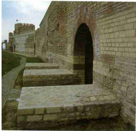
Boven: de door keizer Theodosius in de vijfde eeuw n. Chr. gebouwde dubbele muren rond Constantinopel (Istanbul) staan nog steeds. Een klein deel is gereconstrueerd. Gedurende duizend jaar hebben ze bestormingen weerstaan.