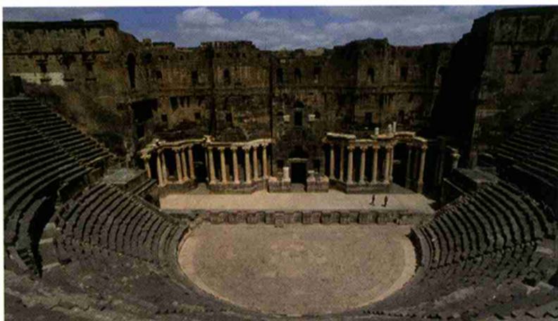
Boven: de ruïnes van het theater van Bostra, in het huidige Syrië, dat na Trajanus' annexatie van Arabia Petraea hoofdstad werd en bloeide.

Toen de koloniën waren gevestigd, ontwikkelde zich een trotse strijd om het Romein-zijn. Lokale aristocratieën, vooral in het westen, wedijverden met elkaar om in kleding, daden en naam Romein te worden – in het nog lang hellenistische oosten lag dat anders. Mannen wier vader Gallische hoofdmannen waren geweest, namen een drievoudige Romeinse naam aan en hun zonen beschouwden zichzelf als Romein. In de eerste eeuw n. Chr. schreef Strabo dat, bijvoorbeeld, in Vienne (Vienna), aan de oevers van de Rhône, 'de Allobrogen altijd oorlog voerden maar er nu de vlakten en valleien bebouwen en in dorpen wonen, behalve hun edelen die