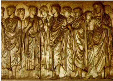
Boven: de Ara Pacis (het vredesaltaar) in Rome toont Augustus, zijn familie en vrienden in traditionele houding, de herinvoering van de Republiek symboliserend.