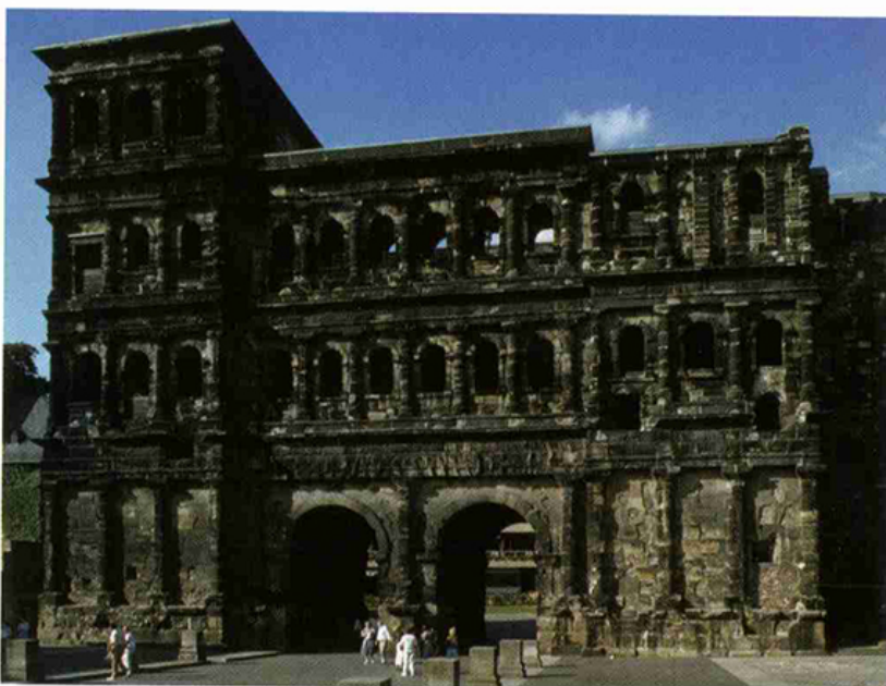
Onder: de Porta Nigra (zwarte poort) was de ceremoniële en versterkte toegangspoort van Trier, de hoofdstad van Gallia in het latere Keizerrijk. De torens zijn meer dan 20 m hoog.