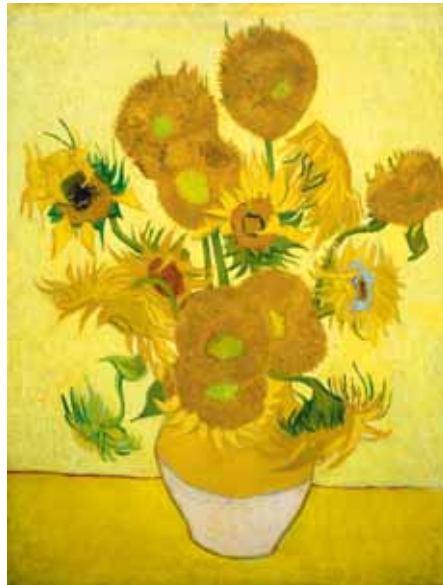
Vincent van Gogh. Zonnebloemen, 1888 Van Gogh Museum, Amsterdam

In 1973 werd het Van Gogh Museum in Amsterdam geopend. Daar zijn meer dan 200 schilderijen, 500 tekeningen, 4 schetsboeken en ongeveer 700 brieven van Vincent te zien. Ook in het Kröller-Müller museum in Otterlo zijn veel schilderijen van Vincent te bewonderen.