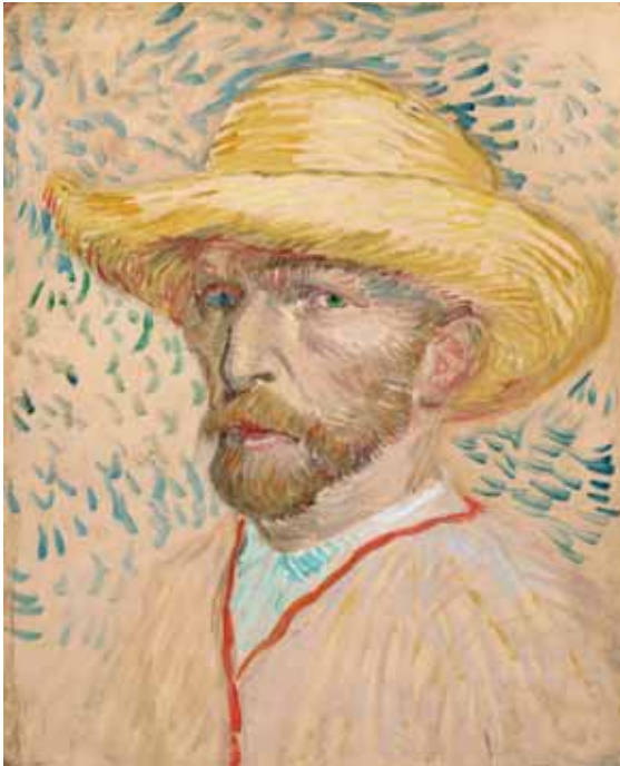
Vincent van Gogh Zelfportret met strohoed, 1887 Van Gogh Museum, Amsterdam

KIJK, HIER HEB JE HEM, HET IS VINCENT VAN GOGH.