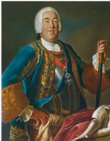
Keurvorst Friedrich August II van Saksen als Poolse koning August III (1696-1763), portret door Pietro Antonio Rotari uit 1755.

Op internet zijn verder talloze uitvoeringen van het Weihnachtsoratorium te vinden. Voor teksten en vertalingen kunt u ook de website van Uitgeverij Rubinstein raadplegen.