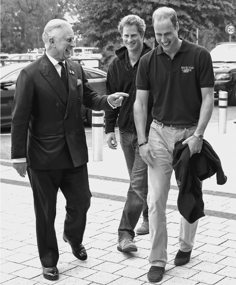
De prinsen Charles, William en Harry arriveren op 11 september 2014 bij de Invictus Games in Londen.