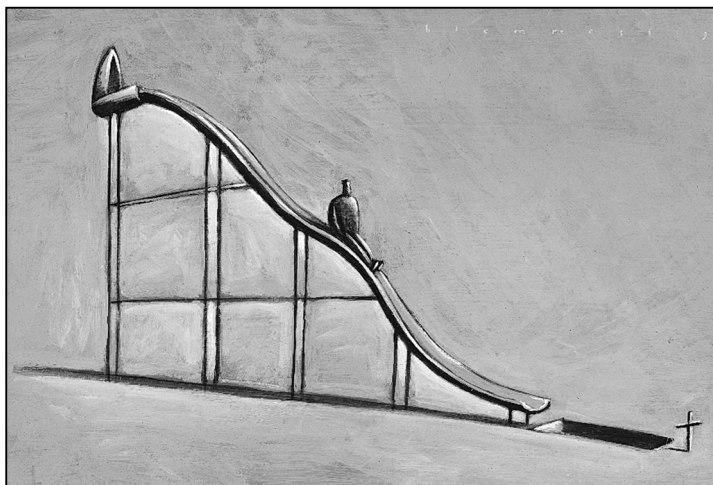
Een moderne levenstrap.

schilderen, Walesa weer op zijn oude werf solliciteerde en menig chansonnière op een tochtig zolderkamertje is weggekwijsd. Maar liefst hebben we toch dat aan beroemde levens op het hoogtepunt dan ook maar meteen een einde komt. Niks aftrainen. John Kennedy, John Lennon en prinses Diana kenden hun plicht wat dat betreft. Dictators horen hun aow al helemaal niet te halen. Adolf Hitler, Ceausescu, Napoleon en al die andere koningen en keizers, ze zijn niet aan de afdaling van de levenstrap toegekomen.