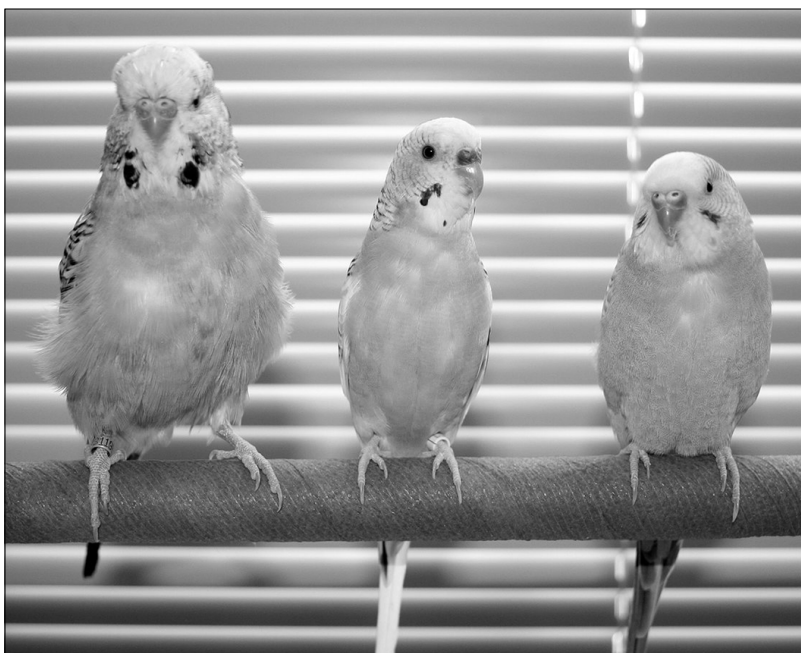
FIGUUR 1.1: De Engelse parkiet (links, mannetje) en gewone parkieten (rechts, vrouwtje en mannetje)