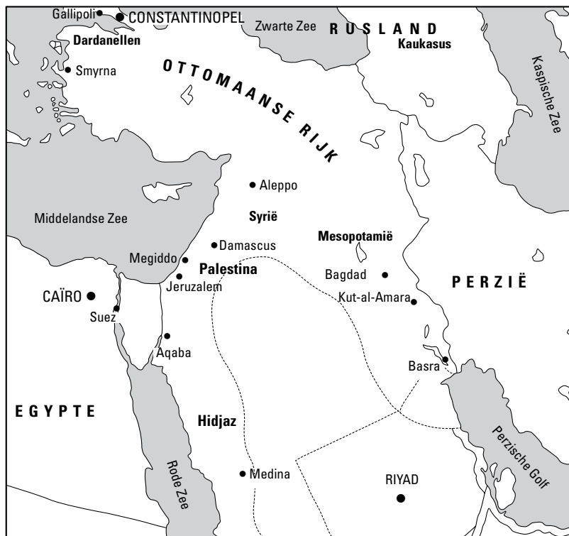
FIGUUR 1.4: Het uitgestrekte Turkse oorlogs- gebied.

anti-Turkse opstand en de Britten begonnen een front vanuit Egypte dat zich noordwaarts bewoog door Palestina en Syrië.