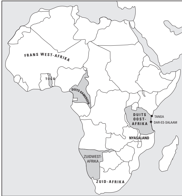
FIGUUR 1.5: Duitse kolonieën in het Afrikaanse oorlogsgebied (donkere gebieden).

ook van de gelegenheid gebruik om Chinees grondgebied in te nemen tot dat China aan dezelfde kant ging meedoen en de geallieerde leiders de Japanners vroegen zich te onthouden van aanvallen op hun bondgenoot.