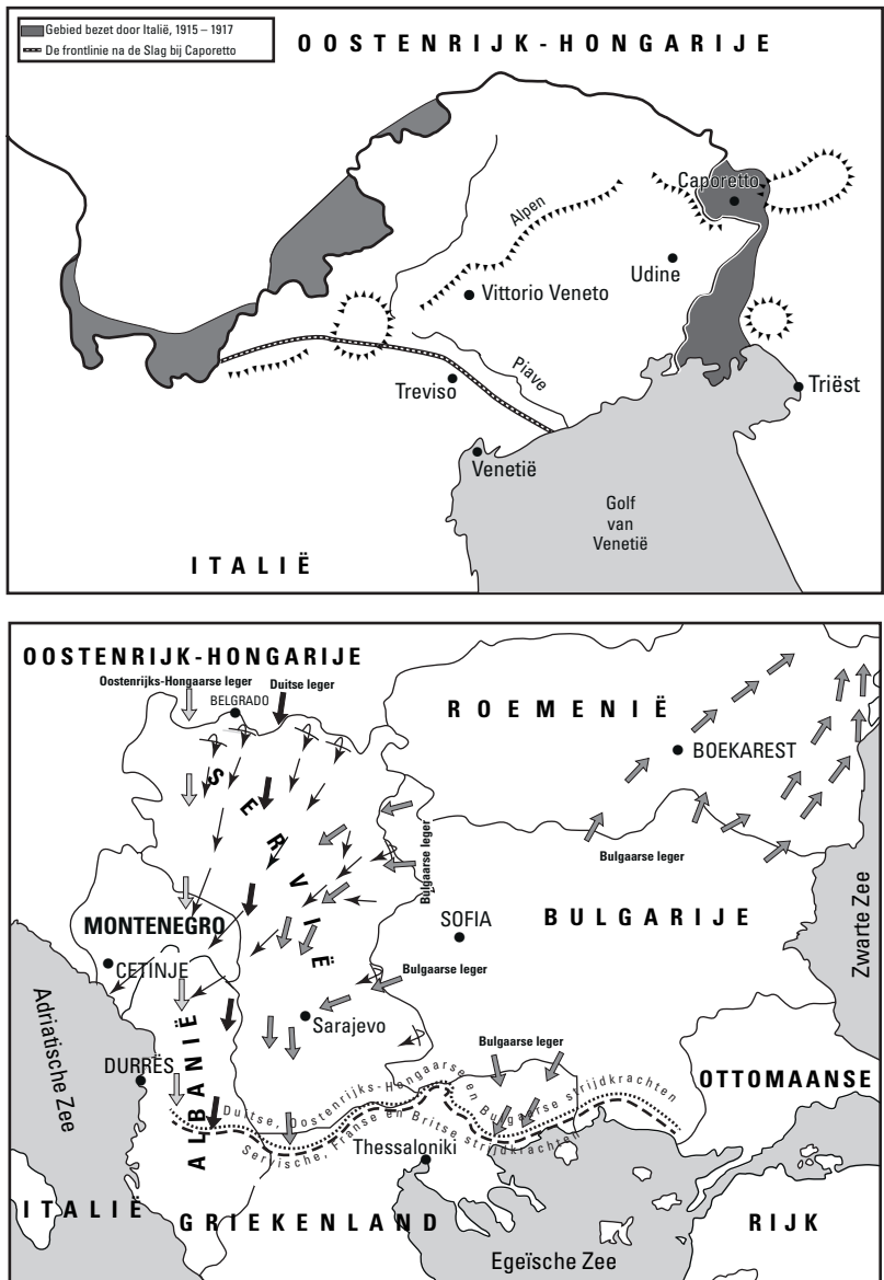
FIGUUR 1.3: Het Italiaanse (boven) en Griekse (onder) front van het zuidelijke oorlogsgebied.