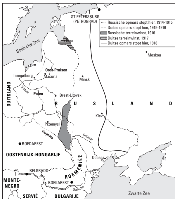
FIGUUR 1.2: Het gebied van het oostfront.

over Oostenrijks-Hongaarse troepen stonden. Roemenië mengde zich in 1916 in de oorlog en breidde zo het oostfront nog verder uit naar het zuiden.