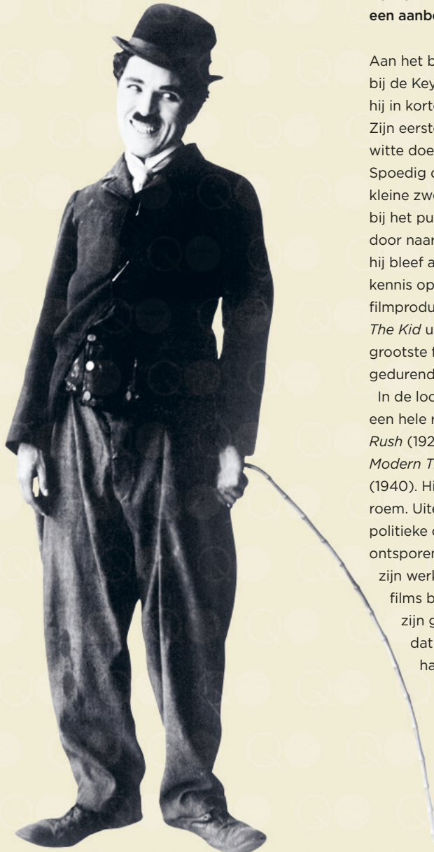
Charles Chaplin als het personage waarmee hij het bekendst is geworden

In de loop van twee decennia maakte Chaplin een hele reeks kaskrakers, waaronder The Gold Rush (1925), The Circus (1928), City Lights (1931), Modern Times (1930) en The Great Dictator (1940). Hiermee bereikte hij een ongekennde roem. Uiteindelijk zouden zijn privéleven en politieke overtuigingen zijn carrière doen ontsporen, terwijl de sentimentele inslag van zijn werk uit de mode zou raken. Maar zijn films blijven boeien en ontroeren dankzij zijn genialiteit als komediant, het gevoel dat uit zijn werk spreekt en zijn warme hart voor de medemens.