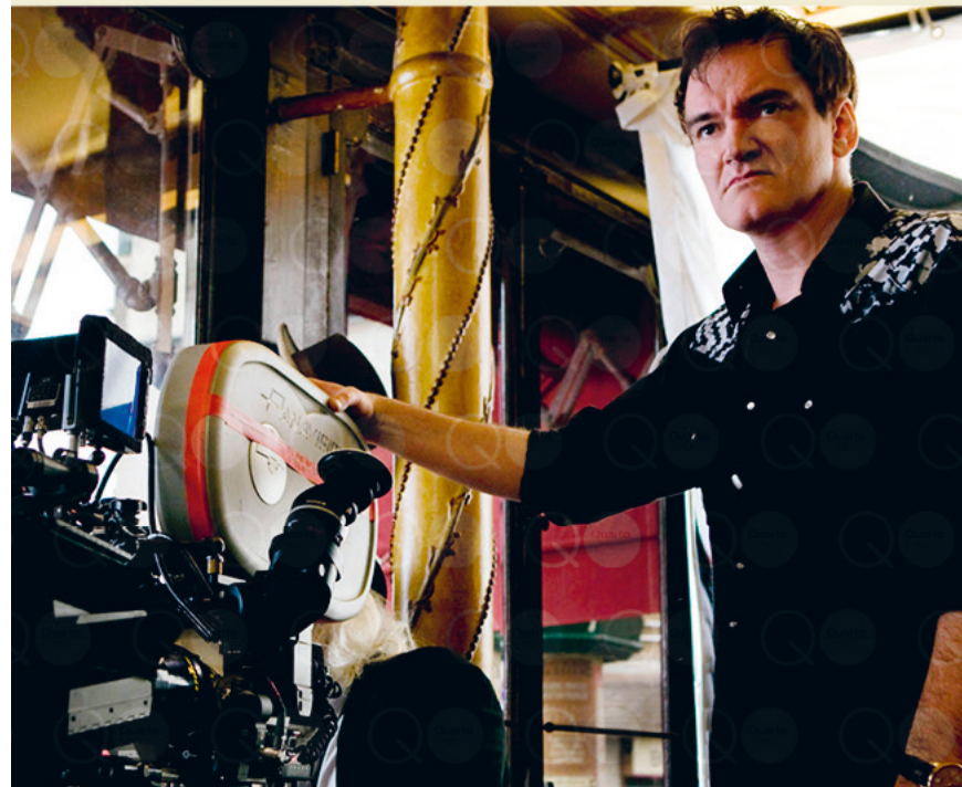
Quentin Tarantino op de set van Inglourious Basterds

In het bloedige Tweede Wereldoorlogavontuur Inglourious Basterds (2009) speelt Tarantino met de geschiedenis. Django Unchained (2012), met zijn stijlelementen van de spaghettiwestern, schildert een schrijnend portret van de slavernij in het zuiden van de Verenigde Staten vóór de Amerikaanse Burgeroorlog. The Hateful Eight (2015) plaatst het genre in een winterse setting. En Once Upon a Time in Hollywood (2019) biedt een nieuwe kijk op de Charles Mansonmoorden door de ogen van een tv-ster wiens carrière berafwaarts gaat.