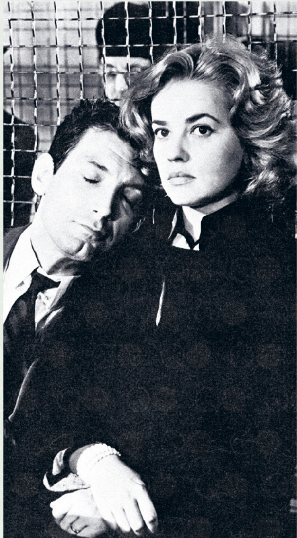
Jeanne Moreau in Ascenseur pour l'Échafaud van Louis Malle

terwijl Louis Malle haar in hetzelfde jaar tegenover Brigitte Bardot liet spelen in de revolutionaire avonturenfilm Viva Maria! Moreau's filmcarrière omspande uiteindelijk zesenvijftig jaar en haar status als een van Frankrijks meest iconische filmpersoonlijkheden is nog altijd helemaal intact.