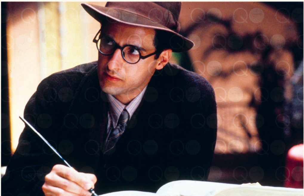
John Turturro in Barton Fink van Joel en Ethan Coen

De manier waarop films worden gemaakt is in de loop der tijd veranderd door de komst van nieuwe technieken en stijlopvattingen – zowel bij de mainstream films, als bij de experimentele en kunstfilms. Scenarioschrijvers schrijven hun scenario op een computer en het format is verder gestroomlijnd door de komst van softwarepakketten als Final Draft. Maar de dynamiek tussen scenario, regie en acteren blijft onveranderd.