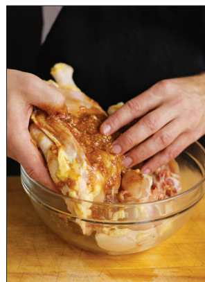
3. Verdeel de marinade erover en laat de kip 1-4 uur marinieren. Hoe langer ze in de marinade ligt, hoe intenser de smaak wordt.