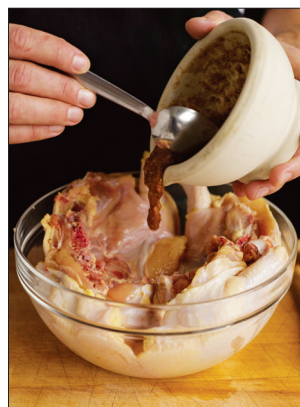
2. Giet de marinade over de kip.