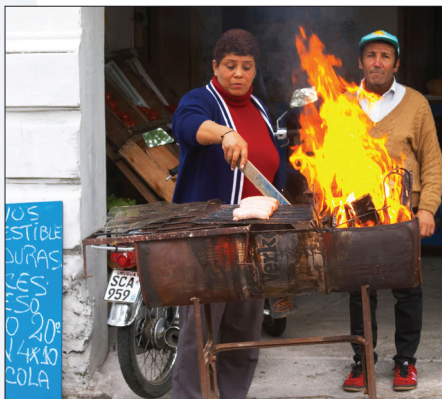
Een straatverkoper in Uruguay grilt worst op een 'mobiele' barbecue.

HET OPMERKELIJKSTE GERECHT OP HET MENU: choto , gegrilde lamsdarmen (ze smaken beter dan de naam doet vermoeden).