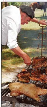
Gaucha-barbecue op een ranch in Uruguay.

In Uruguay duurt een typische barbecue bijna een hele middag. Je begint met gegrilde kaas, plakken provoleta die rechtstreeks op het rooster worden gebakken tot ze smelten en borrelen; en daarna