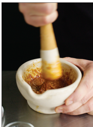
1. Stamp de smaakmakers fijn in een vijzel.