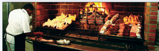
Een typische Uruguayaanse barbecue. In de metalen mand in het midden worden houtblokken verbrand tot sintels, die onder het eten worden geharkt.

Uruguay kan prima opboksen tegen de twee barbecuegrootheden aan weerszijden: Argentinië en Brazilië.