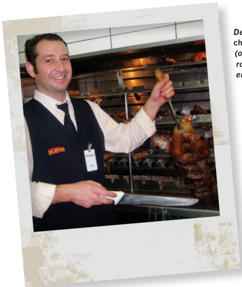
Deze Braziliaanse churrasqueiro (ober-grillmeester) roostert het vlees en dient het op.

Italiaanse aan het spit geroosterde ossenhaas: rijg de ossenhaas aan het spit, bestrijk hem met olijfolie en bestrooi hem met zout en gekneusde peperkorrels, net als in stap 3. Bestrooi hem dan met 3 fijngesneden teentjes knoflook en 3 eetlepels gehakte verse rozemarijn of salie (of een mix). Sprenkel er nog wat olie over en druk de smaakmakers goed tegen het vlees. Rooster de ossenhaas zoals in stap 4. Besprenkel het vlees na het snijden met wat extra vergine olijfolie. Benissimo!