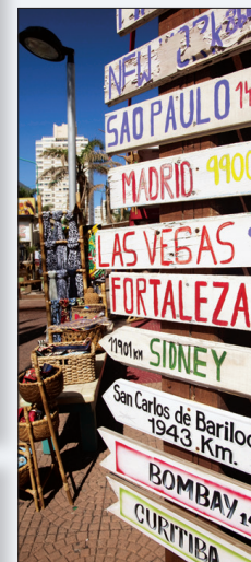
Wegwijzers in Punta del Este. In Uruguay leiden alle wegen naar een barbecue.