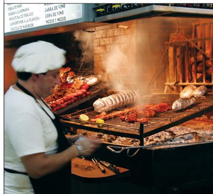
Een grill in het barbecuecentrum van Uruguay, de Mercado del Puerto (havenmarkt) in Montevideo. Het rooster loopt schuin omhoog voor verschillende grilltemperaturen.

DE SMAKEN: in Uruguay worden weinig speciale specerijen of marinades gebruikt. Zout is de voornaamste smaakmaker, vaak in grote hoeveelheden.