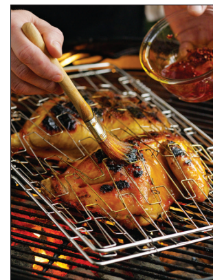
4. Bestrijk de kip tijdens het grillen met de annatto-olie; die geeft kleur, glans en smaak.