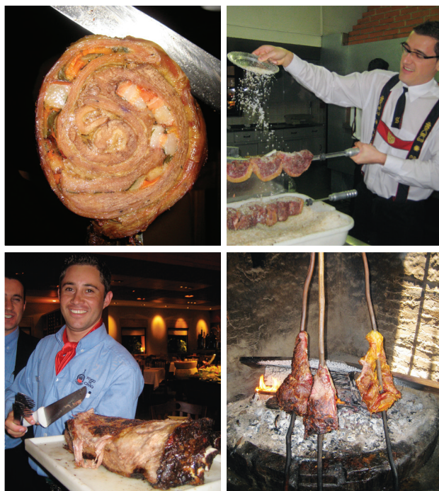
MET DE KLOK MEE VANAF LINKSBOVEN: matambre (opgerolde, gevulde vanglap) staat klaar om gesneden te worden; een Braziliaanse picanha (bovenstuk van de varkenslende) wordt bestrooid met zout; mamona (Colombiaans kalfsvlees) aan stokken naast een eucalyptusvuur; het grootste runderribstuk van de wereld wordt gebraden boven een fogo de chão (kampvuur).

In dit hoofdstuk staat voor iedere vleesliefhebber wat lekkers - of je nu houdt van grote, rokerige lappen vlees of kleine spiesjes, van gegrilde of aan het spit geroosterd steaks of van vlees dat net als in de oertijd in de sintels is geroosterd.