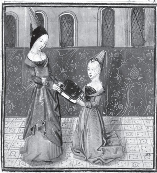
Christine de Pizan presenteert haar boek aan de gelijknamige nicht van Margaretha van Bourgondië, de hertogin van Guyenne, ca. 1475.

ieder op hun eigen manier bij aan de wordingsgeschiedenis van de Nederlanden. Als vorstinnen regeerden zij over (delen van) het gebied dat uiteindelijk Nederland en België zou worden. Zij waren actief als bestuurders, diplomaten, patronessen, beheerders van bezittingen, bemiddelaars en als militair strategen. 3 De auteurs van de portretten, allen (kunst)historici, beschrijven vanuit het perspectief van de vrouwen de politieke rollen die zij speelden en welke instrumenten ze daarbij gebruikten. Deze bundel bewijst dat we de geschiedenis van de Nederlanden niet alleen moeten associëren met Willem van Oranje, Johan van Oldenbarnevelt en Johan de Witt, maar ook met bijvoorbeeld Margaretha van Bourgondië, Maria van Oostenrijk en Albertine Agnes van Oranje-Nassau.