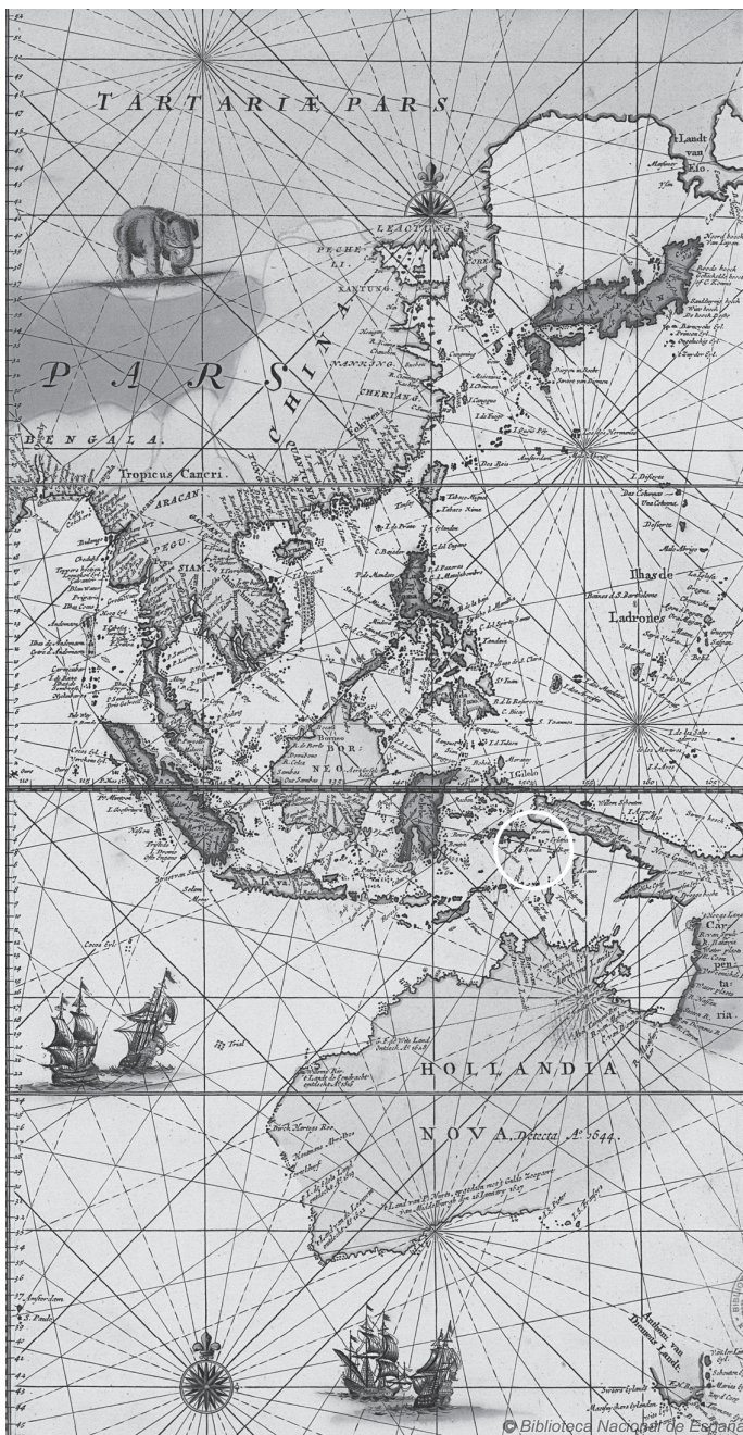
Johannes van Keulen, Nieuwe Pascaert van Oost Indien (1689). Biblioteca Digital Hispánica. Foto: Wikimedia Commons. (De Banda-eilanden zijn te zien in de witte cirkel.)