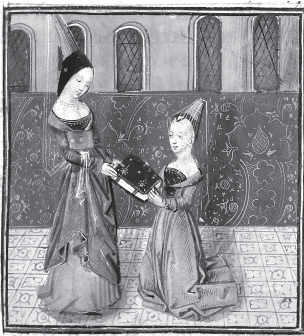
Christine de Pizan presenteert haar boek aan de gelijknamige nicht van Margaretha van Bourgondië, de hertogin van Guyenne, ca. 1475. Bibliothèque nationale de France, Parijs, Fr. 1177, fol. 114.

ieder op hun eigen manier bij aan de wordingsgeschiedenis van de Nederlanden. Als vorstinnen regeerden zij over (delen van) het gebied dat uiteindelijk Nederland en België zou worden. Zij waren actief als bestuurders, diplomaten, patronessen, beheerders van bezittingen, bemiddelaars en als militair strategen. 3 De auteurs van de portretten, allen (kunst)historici, beschrijven vanuit het perspectief van de vrouwen de politieke rollen die zij speelden en welke instrumenten ze daarbij gebruikten. Deze bundel bewijst dat we de geschiedenis van de Nederlanden niet alleen moeten associëren met Willem van Oranje, Johan van Oldenbarnevelt en Johan de Witt, maar ook met bijvoorbeeld Margaretha van Bourgondië, Maria van Oostenrijk en Albertine Agnes van Oranje-Nassau.