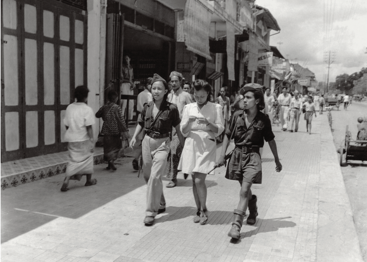
[7] Drie jonge Indonesiërs op straat in Yogyakarta, foto door Hugo Willmar, december 1947. De gewapende jonge mannen behoren tot de milizie Kebaktian Rakjat Indonesia Sulawesi (KRIS, Dienst van het Indonesische volk uit Sulawesi)