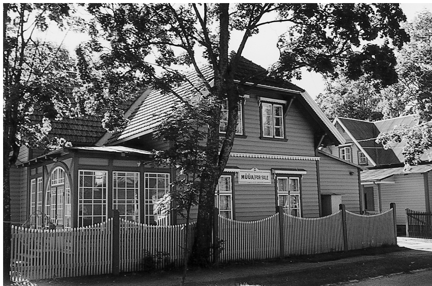
Huis in Pärnu, Estland.

kobson'. Na veertig kilometer verliet hij de hoofdweg en reed een pad op. Bij een watermolen stapten we uit en liepen een landgoed op. De stilte deed vermoeden dat de hemel met fluweel was bekleed. Estland mag dan de afmetingen van Nederland hebben, er wonen tien keer minder mensen. Misschien kwam het daardoor dat de vogels zachter floten.