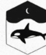
Arkteinen † Austrel