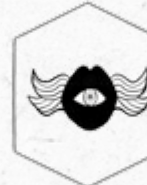
Mardici † Kalyptikari