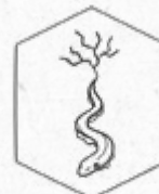
Shandianzi Tian Ti