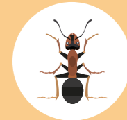
Behaarde rode bosmier