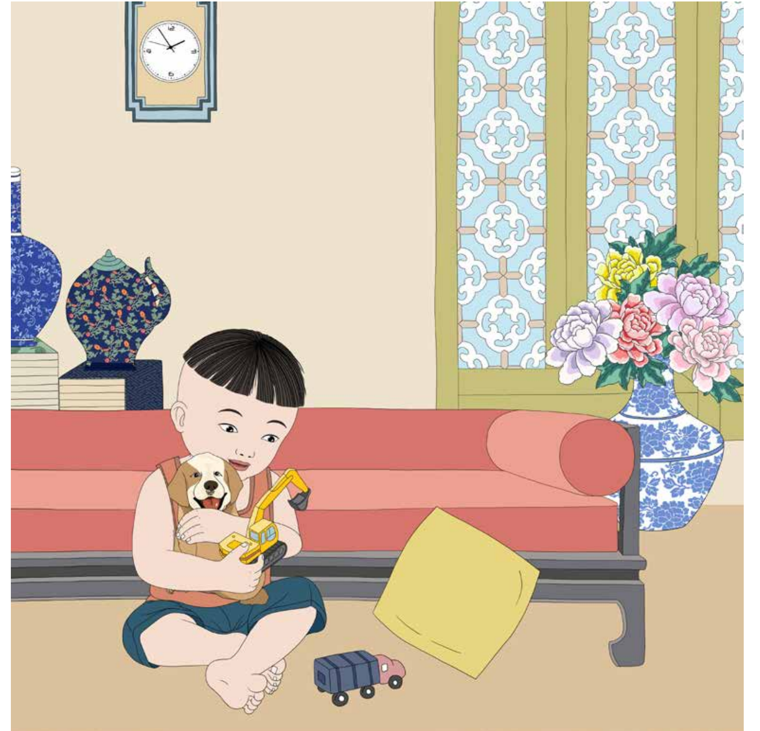
Op een luie namiddag zat Tuanzi thuis met zijn hondje Wangwang te spelen. Toen zijn moeder even naar de winkel ging, was het hele huis van hen alleen!