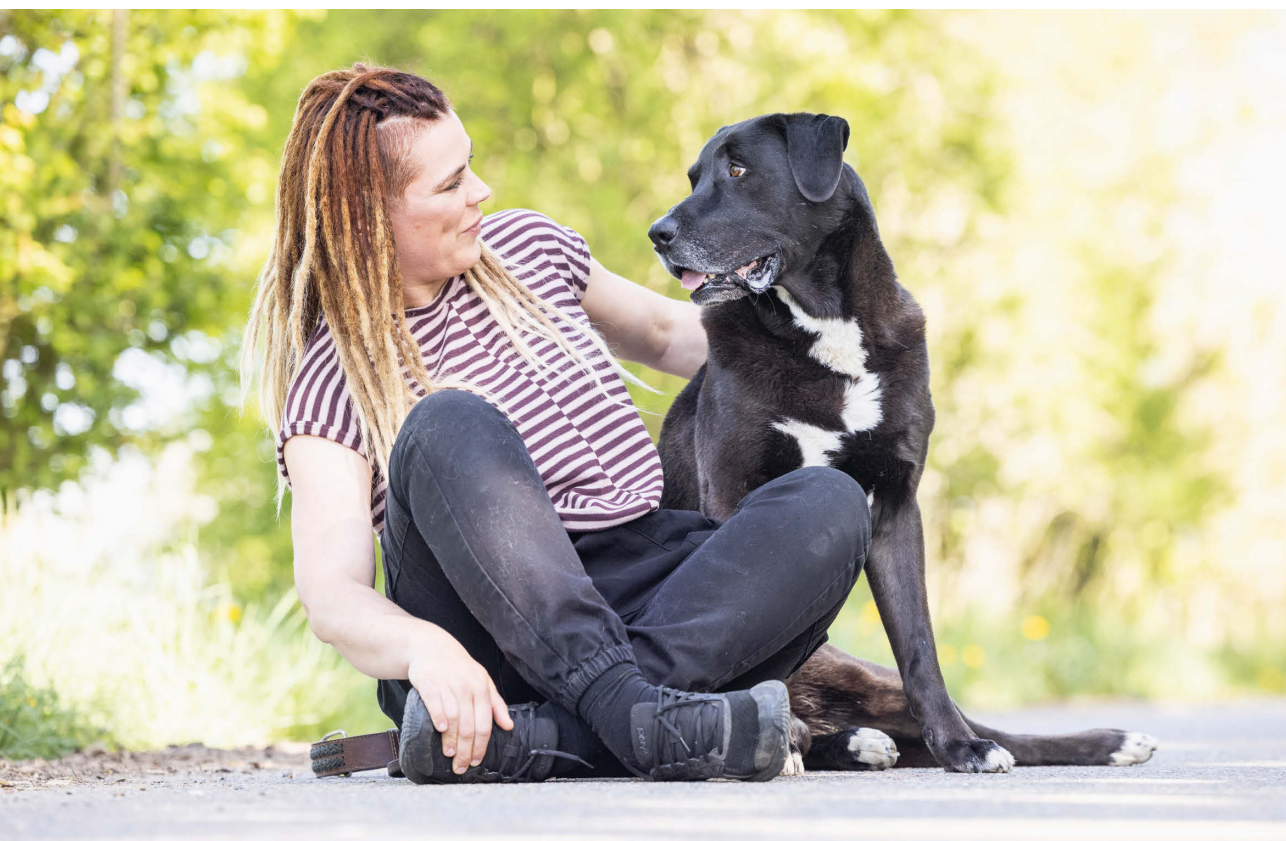
De auteur en Nanu

‘We gaan samen op ontdekkingsreis door de kop van je hond!’