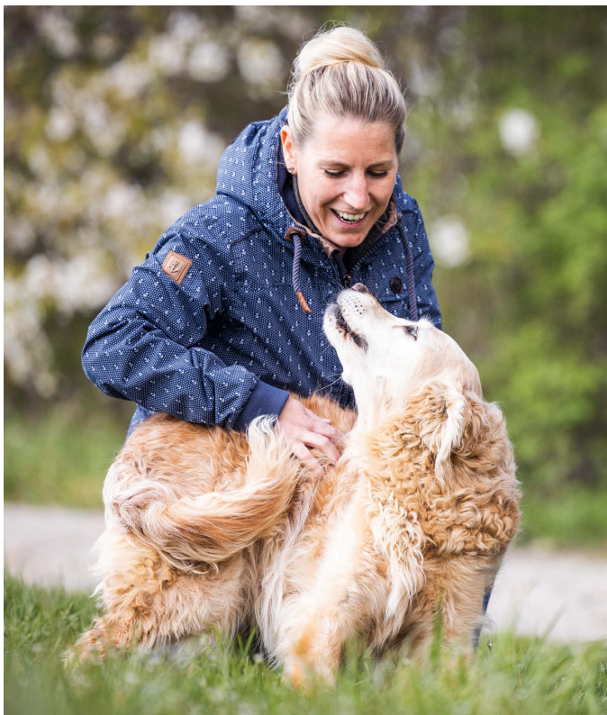
Draaiende, zachte bewegingen wijzen op actieve onderwerping.

... dat er bij honden geen rangorde bestaat? Honden staan niet hoger of lager op de ladder dan hun soortgenoten. Wat van belang is, is de individuele relatie tussen honden onderling. Elke relatie is gebaseerd op een andere kwaliteit en positie in het leven van de hond.