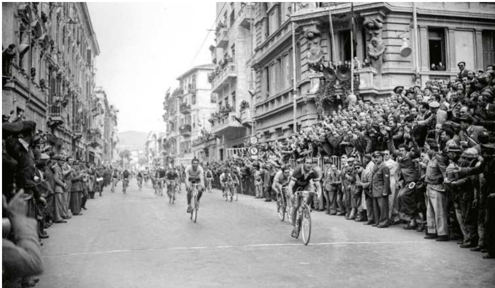
1950, Via Roma. De 'Bartalisten' schreeuwen het uit! Gino Bartali verslaat Logli en Conte, en doet daarmee meer dan winnen: met deze vierde zege verslaat hij Coppi, die er 'slechts' drie op zijn conto schreef.

numenten. Geen enkele andere wedstrijd op de huidige kalender bestrijkt zo'n lang parcours: meer dan 300 kilometer. Dat is trouwens zo ongeveer zijn enige feitelijk onweerlegbare eigenschap, want voor de rest doen over deze koers veel meningen de ronde. Dit zou de makkelijkste zijn om uit te rijden, maar de moeilijkste om te winnen. Hij wordt beschouwd als een terrein voor sprinters, maar toch hebben zij al vaak naast de overwinning gegrepen. Eerlijk gezegd is Milaan-San Remo de meest onvoorspelbare van alle klassiekers. De teerling wordt geworpen boven op de Poggio, waar iedere renner bidt dat hij aan de juiste kant van de borstwering terecht komt