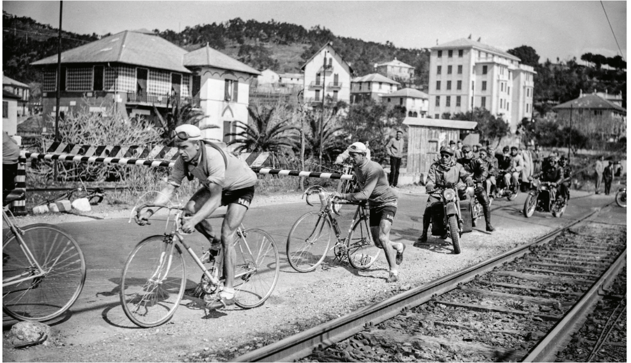
Gino Bartali in 1949. Dit is het jaar van Coppi, maar de mooie Gino zal het jaar erna zegevieren.