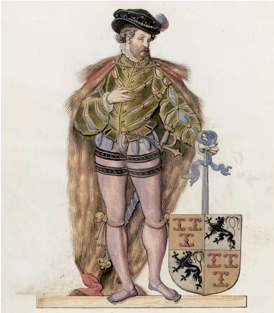
o.7 Gerrit II, heer van Culemborg, toegeschreven aan Nicolaes de Kemp, ca. 1590.

toon. De Borchstraat, zoals de Slotstraat toen heette, was nog maar nauwelijks bebouwd. Slotstraat 10-12 had reusachtige afmetingen, 26 meter breed en 18 meter diep. Het hoogste deel mat ruim 17 meter en het geheel had een inhoud van ruim 5000 m 3 . Bouwheer was Zweder van Culemborg, de favoriete bastaardzoon van de toenmalige heer van Culemborg. Wie zijn moeder was openbaren de archieven niet. De heer zelf, Gerrit II, de grootvader van Elisabeth, torede hoog boven het Huis van de Bastaard uit, zoals het in de wandeling al snel genoemd werd, in het op nog geen 100 meter afstand gelegen machtige kasteel van Culemborg. Van daaruit hield hij een scherp oog op de Europese spanningen in dit tijdvak.