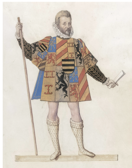
0.2 Heraut van Culemborg, toegeschreven aan Nicolaes de Kemp, ca. 1590. Herauten waren herkenbaar gekleed en deden dienst als boodschapper van hun heer. Ze waren ongewapend maar onschendbaar.

Waarom vonden de ouders de kosten die verbonden waren aan het zenden van een heraut goed besteed en waarom was het Culemborgse stadsbestuur zo opgelucht over de inhoud van het bericht? Over de geboorte van het oudste kind, Elisabeth, ook in Hoogstraten, een jaar eerder op 30 maart 1475, hadden de ouders immers geen drukte gemaakt. Onder de hoge adel gold een huwelijk doorgaans pas als vruchtbaar als het een mannelijke erfgenaam had opgeleverd. Jongens stonden immers garant voor de toekomst van de