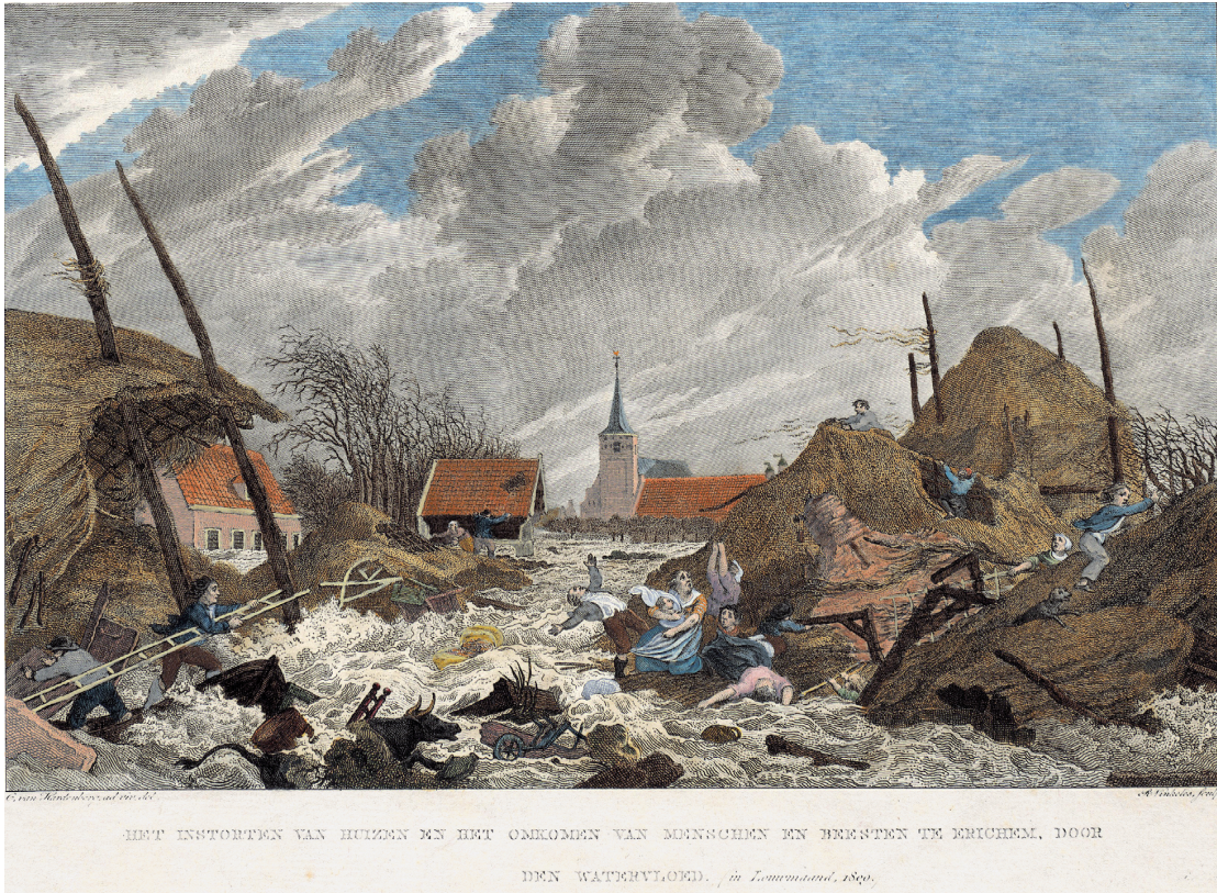
Reinier Vinkeles, Ramptafereel van de watersnood van 1809 te Erichem , Rijksmuseum Amsterdam.

zich de langdurige droogte van 1540, die gepaard ging met ziekte-uitbraken, of de overstroming van de Maas in 1643, waarbij mogelijk 500 doden vielen, of de stormvloed van 1682, toen 161 polders onder water liepen en tientallen mensen verdronken? Wie herdenkt de watersnood van 1809, die aan zo'n 275 personen het leven kostte?