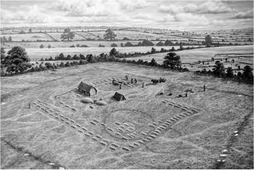
Reconstructie van de zevende-eeuwse site in Street House, Loftus door Andrew Hutchinson. © Andrew Hutchinson en Stephen Sherlock

van vele eeuwen oud. Stenen van oude Romeinse structuren liggen verspreid en een paar nieuwe houten gebouwen verrijzen tussen grafheuvels en verhoogde greppels.