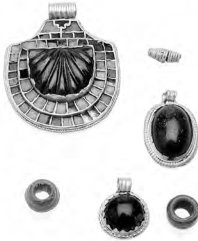
Hangars van goud en granaat uit graf 42, Street House, Loftus.

granaat in de vorm van een jakobsschelp van bijna 2 centimeter breed. Iets dergelijks was nog nooit gevonden en het suggereerde dat de in graf 42 geëerde persoon erg belangrijk was – waarschijnlijk iemand uit een koninklijke familie of de adel. Het suggereerde ook dat ze een vrouw was. 8