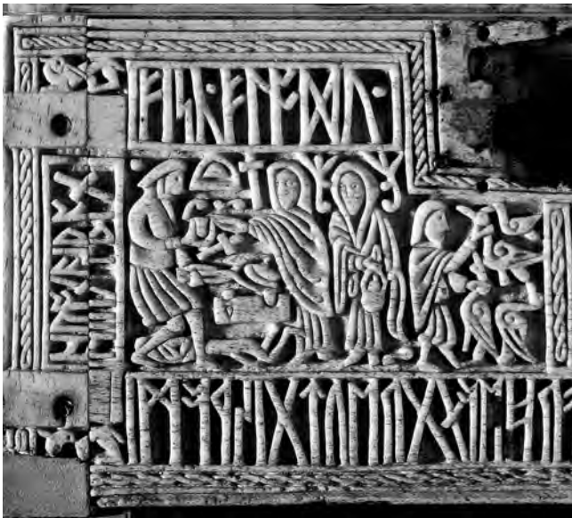
Afbeelding van de smid Wieland op de voorkant van de Franks Casket, British Museum

In de zevende eeuw zag men smeden als machtige en belangrijke leden van de samenleving. Dit was een overblijfsel van de Germaanse heidense religie die in heel Engeland werd gepraktiseerd voor de komst van christelijke missionarissen. Een gevierde mythische figuur was de smid Wieland. In de Poëtische Edda staat zijn verhaal. Wieland was zo'n geweldige sieraadmaker dat koning Níðuðr hem als slaaf wilde, zodat verder niemand de