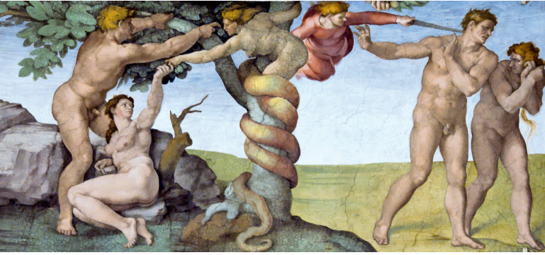
Verdreven uit de Tuin van Eden, Sixtijnse kapel, Michelangelo. Veel geschiedenissen van de natuur hebben de structuur van het Paradijsverhaal: ooit was er harmonie tussen mens en natuur, toen kwam de zondeval en daarna is het alleen bergafwaarts gegaan.

Met dit boek willen we aantonen dat de geschiedenis niet goed begrepen kan worden met een dergelijk simpel schema. We zullen betogen dat er vroege perioden van dramatische afname van de soortenrijkdom geweest zijn – zoals het uitsterven van de megafauna meteen nadat de moderne mens ten tonele was verschenen. Maar er zijn ook goede historische voorbeelden van toenemende biodiversiteit onder menselijke invloed – in het verre en nabije verleden. Analyse van de oorzaken daarvan – en erkenning van het feit dat de natuur niet onstuitbaar achteruitgaat – maakt het mogelijk toch een beetje hoop te putten uit de geschiedenis van de natuur. Natuurbescherming, het terugdringen van vervuiling en het scheppen van ruimte voor de natuur kunnen helpen, en het is mogelijk, zelfs in het drukbevolkte Nederland, een gevarieerde natuur in stand te houden.