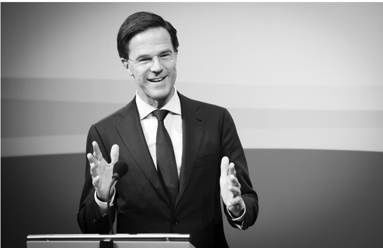
Mark Rutte: gebaren en mimiek

Keuzes liggen in een democratie nooit vooraf al vast; daarin past geen publieke predestinatie. En de overheid is ook niet eender welk bedrijf dat via logische afleidingen en spreadsheetberekeningen zo- wat op de automaat gerund kan worden, zoals de afgelopen decennia nog wel eens wordt voorgesteld. In een democratie ligt het eigenaarschap van de overheid bij de burgers, gaat politiek om ‘ons’ en staan ‘wij’, de kiezers en de burgers, aan het stuur en vormen zo het hart