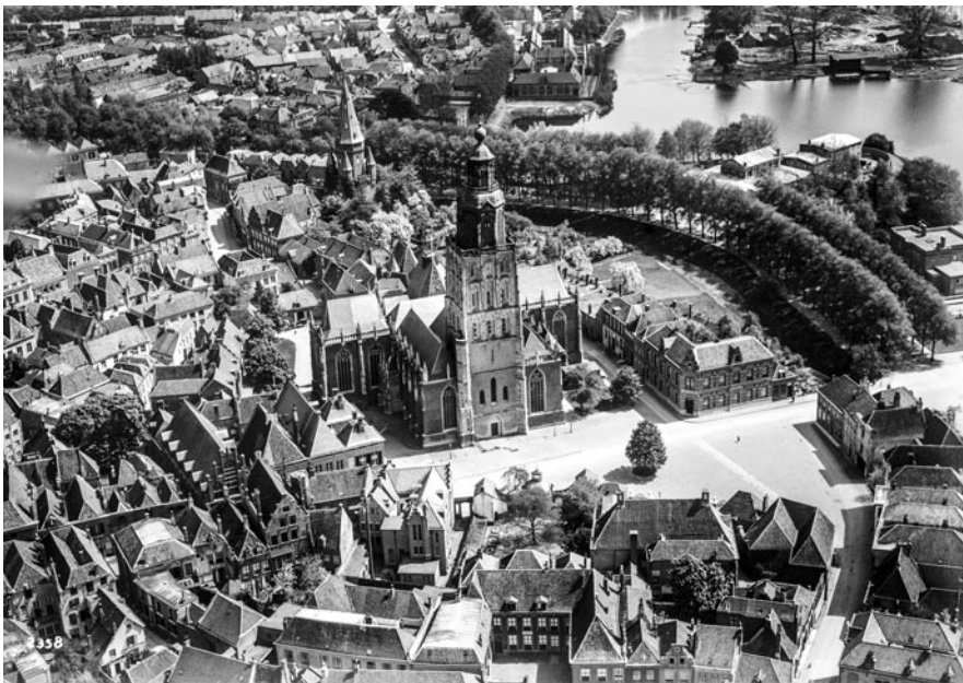
Het gymnasium van Zutphen, op de hoek rechts naast de kerk.