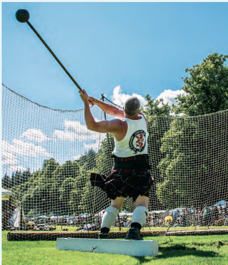
Hammerslingeren, hier tijdens de Inveraray Argyll Highland Games, is een kwestie van kracht en balans.

Elk van de Highland Games heeft zijn eigen tradities en onderdelen. Soms is er ook een veekeuring of een wedstrijd schapen drijven voor honden. Spectaculair zijn ook de optredens van Highland dancers, die de bewegingen van de hertenbokken in de heuvels imiteren.