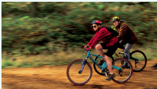
Mountainbikers rijden over een bospad in Mabie Forest, in Dumfries en Galloway.

De reis indelen 286-287 • Reizen naar en in Schotland 287-289 • Praktische tips 289-292 • Noodgevallen 292-293 • Literatuur 293 • Hotels 294-305 • Winkelen 306-307 • Uitgaan 308-309 • Activiteiten 310-313