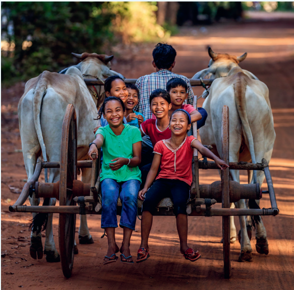
Cambodjanen maken nog altijd gebruik van ossenkarren als middel van vervoer.

Buiten de stedelijke gebieden zijn de meeste secundaire wegen niet meer dan karrensporen, die afhankelijk van het seizoen veranderen in een modderpoel of een harde, bobbelige ondergrond. Om het platteland van Cambodja echt te kunnen ervaren, is een 4wd of een offroadmotor onontbeerlijk.