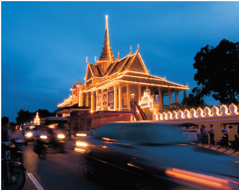
De verlichte toegangspoort van het koninklijk paleis bij avond.

Aan de brede straten in het centrum, ten zuiden van de Wat Phnom aan de Tonle Sap, liggen nationale schatten als het koninklijk paleis, de Zilveren Pagode, het Nationaal Museum en de Koninklijke Academie van Beeldende Kunsten. U ziet er ook groene parken en enkele belangrijke boeddhistische bezienswaardigheden: de Sarawanpagode, Wat Ounalom en Wat Langka.