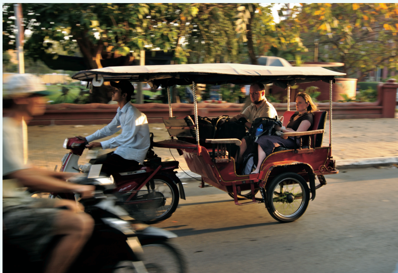
De tuktuk: snel en goedkoop.

vroeg, bijvoorbeeld door van dag 6 op dag 7 hier te overnachten en na een vroeg bezoek aan het park terug te reizen naar Phnom Penh om uw vlucht te halen.