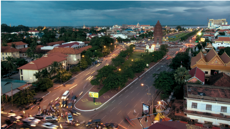
Blik op het Independence Monument in Phnom Penh en het drukke stadsverkeer.

Vroeger kwamen toeristen in Cambodja aan via de luchthaven van Siem Reap met als enige doel de prachtige tempels van Angkor, maar tegenwoordig staat de hoofdstad weer stevig op de kaart als het politieke, economische en commerciële centrum van het land, en fungeert dankzij haar centrale ligging en internationale luchthaven als de poort naar bezienswaardigheden in het hele land, waaronder het beroemde Angkor.